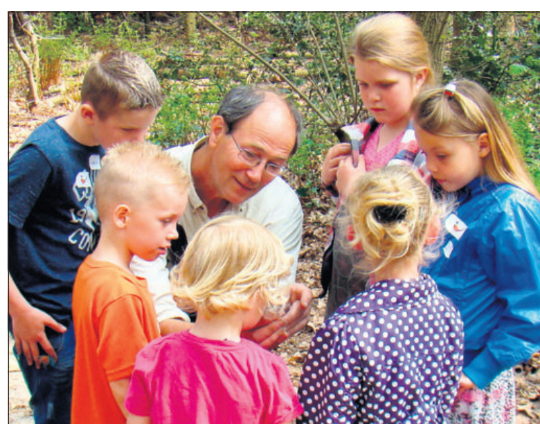
Kinderen vertellen over de natuur is dankbaar werk.

Deelnamekosten zijn € 350 euro (inclusief lesmateriaal). Vooropleiding is niet vereist, wel