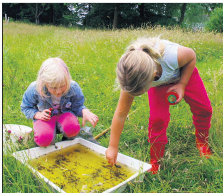
Concentratie van Scharrelkids bij het ontdekken van waterdiertjes.

Tachtig kinderen meldden zich aan, tien IVN'ers en ouders boden hulp. De groep kreeg als naam Boskids. Spannende dingen beleven in het bos of op de heide bleken dieper te grijpen dan computerspelletjes. Het is echt beleven, een blijvende herinnering. De meeste kinderen hadden nog nooit een kikker op de hand gehad, een adder gezien, een hut gebouwd of met een schepnetje waterdieren gevangen. Maar hoe nu verder, na groep 6. IVN Hoogeveen loste het op. Nu, in 2016, he-