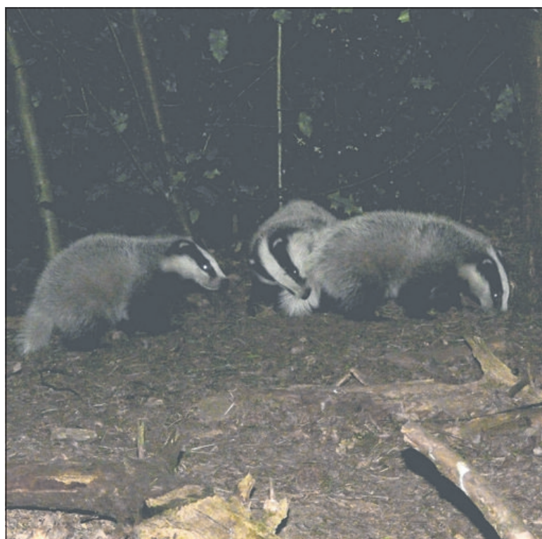
Spelende jonge dassen bij een burcht onder de rook van Hoogeveen.

dienst Landelijk Gebied en werkt aan de inrichting van een aantrekkelijk landschap waarin ruimte is voor natuur, landbouw en recreatie. De provincies Groningen en Drenthe zijn samen eigenaar van Prolander. Het faunabeheer is in