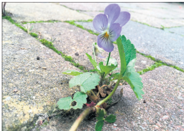
Bloeiend viooltje tussen de tuintegels.

De rucola schiet door, de rode biet is slakkenvoer en de viooltjes laten zich niet zien. 'Geduld, Grietje, geduld, het gaat vast gebeuren.' Dan zit er ineens een