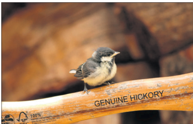
Een jonge koolmees heeft het nestkastje in onze tuin verlaten.

Een tijdje geleden stelde de gemeente ons de vraag: 'IVN, kunnen we samen de schouders zetten onder het op natuurlijke wijze bestrijden van de eikenprocessierups?' Een vraag die wij graag beantwoorden met 'ja'. Daarom