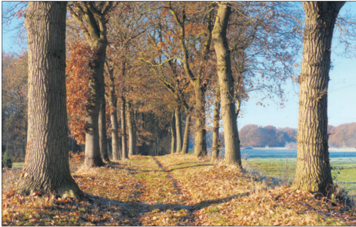
Eikenlaan met esbosje in het Oosterveld bij Zuidwolde.