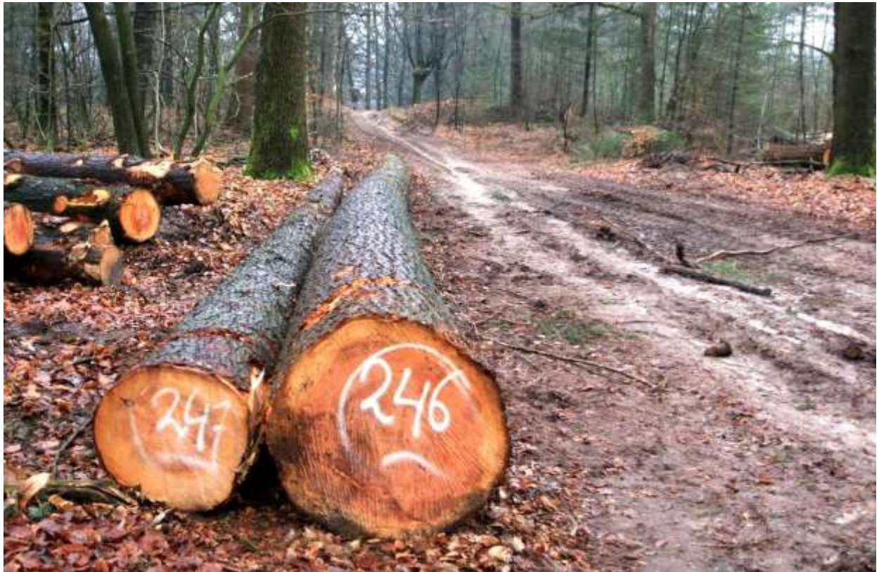
Gerooide douglas sparren in Kwinteloijen