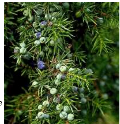
Bessen van de jeneverbes

Ook ziet u een eenzame jeneverbes staan, die hier niet vaak voorkomt. Het is een van de weinige oude inheemse naaldbomen. [ stekels. De boom is taai en groeit erg langzaam.