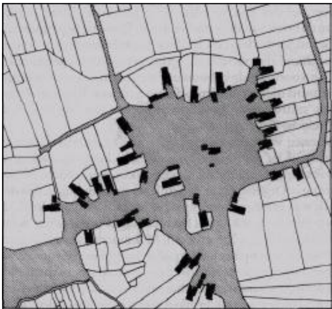
Afbeelding 11.6 Ligging van boerderijen ten opzichte van open ruimten. (Naar: Kadastraal minuutplan Zuidbarga, gemeente Emmen, sectie D, omstreeks 1830; schaal 1:2500.)

De 'schijnbare ordeloosheid' in de structuur van de Drentse esdorpen is voor een groot deel te verklaren uit de ligging van de boerenhuizen ten opzichte van de open ruimten en wegen. Op de oudste kadastrale plans (zie afb.) kan men deze relatie duidelijk vaststellen: dwarsdeeltypen liggen met de zijkant, midden-longsdeeltypen vaak met de achterzijde naar de open ruimte, brink of het pad gekeerd.