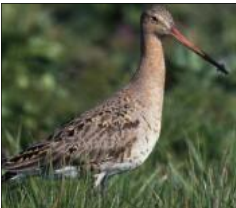
De Grutto, de koning onder de weidevogels, liep in 35 jaar tijd terug van 1208 paren naar een schamele 51 (gegevens A.J. van Dijk en J. Kleine). Het ziet er naar uit dat deze weidevogel binnen 10 jaren geheel uit Westerveld zal zijn verdwenen. De locaties van Diever (D), Dwingelderveld (Dw), Havelte (H) en Vledder (V) zijn apart aangegeven.

In de jaren zestig van de vorige eeuw waren weidevogels in Zuidwest-Drenthe niet van de lucht! Overal waar maar open landschap was, werd je in het voorjaar verwelkomd door duikende kieviten, door de lucht jakkerde grutto's en de weemoedig jodelende wulpen. In de beekdalen en op de heide zaten bovendien nog weidevogels als Kempphaan, Tureluur, Watersnip, Slobeend en Zomertaling. Loop je nu in dezelfde gebieden rond dan is het er veelal stil of je hebt het geluk nog de laatste Grutto, Wulp of Tureluur te