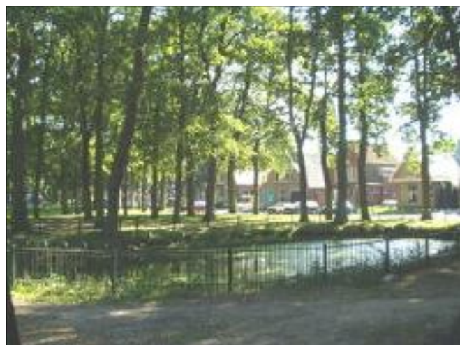
Eén van de Brinken van Zuidlaren