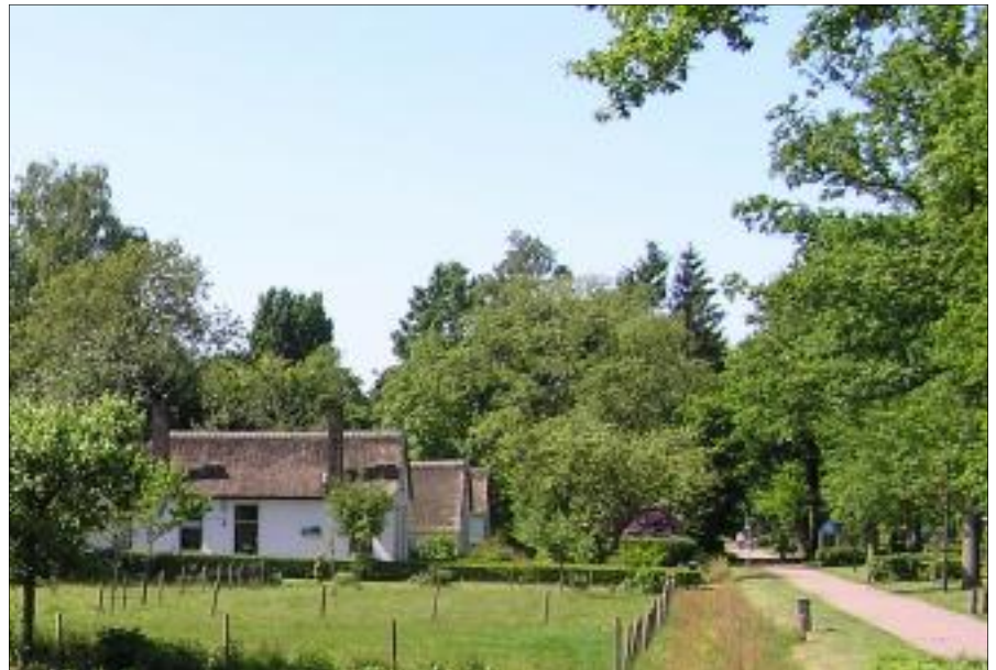
Koloniehuisjes bij Frederiksoord

Er bestaan plannen om de loop van de Vledder Aa verder stroomafwaarts eveneens te herstellen en rondom de Havelterberg worden nieuwe plannen gerealiseerd waarin de oorspronkelijke waarde van dit historische landschap behouden blijft. Er ligt zelfs een plan van Wold naar Weerribben op de plank dat een robuuste verbinding tussen de Nationale parken De Weerribben en het Drents Friese Wold moet realiseren.