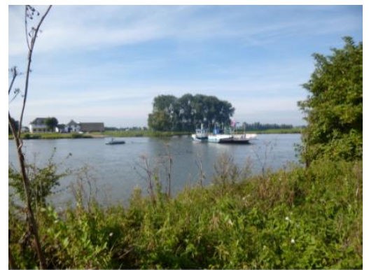
Pontje in de Nederrijn

Deze fietstocht leidt u langs een aantal typische landschappen van de regio. Nadat u de bosrijke Heuvelrug gepasseerd bent, steekt u bij Elst de Nederrijn over en rijdt u over de dijk met aan de ene kant uitzicht op de Betuwe en aan de andere kant de uiterwaarden van de rivier. Wanneer u bij Opheusden weer de pont neemt, fietst u langs de natuurgebieden de Blauwe Kamer en de Grebbeberg om vervolgens over een mooi fietspad langs de Grift de Gelderse Vallei in te rijden.