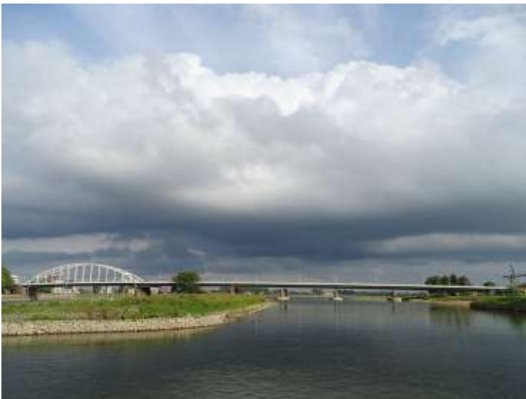
Hank richting Wilhelminabrug