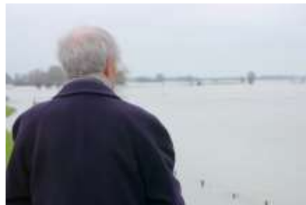
Hoog water januari 2018, punt bij Het Tolhuis

LOOP DOOR HET KLAPHEK DE UITERWAARD IN RICHTING LEBUÏNUSTOREN, STOP HALVERWEGE SPOORBRUG EN PONTJE