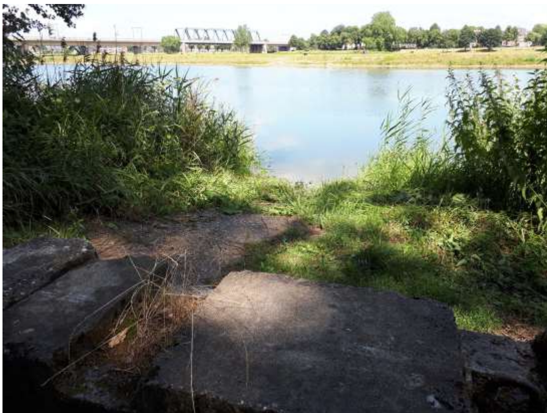
Betonblok bij de hank

dichter van Overijssel van 2015 tot 2016