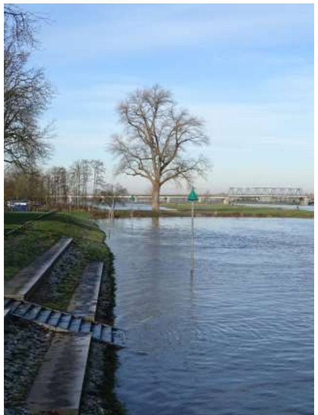
Hank richting bakenboom en spoorbrug