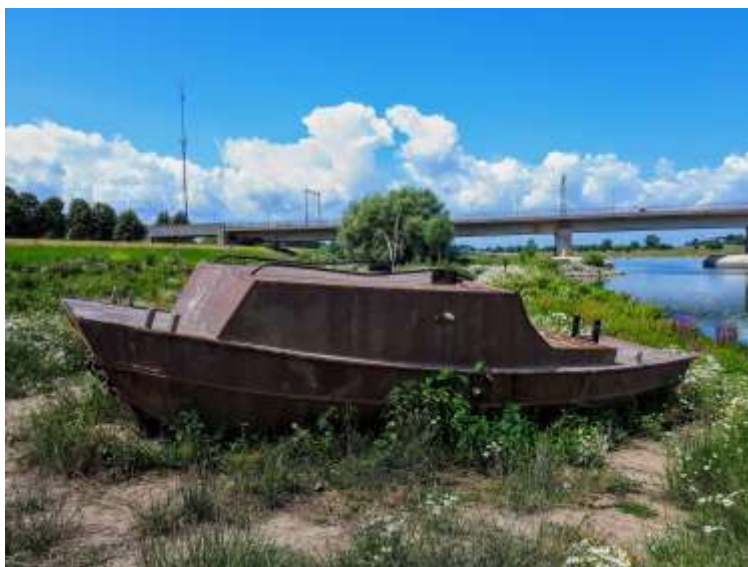
boot Woeste Willem

Boudewijn Betzema dichter van Overijssel 2015-2016 en troostdichter