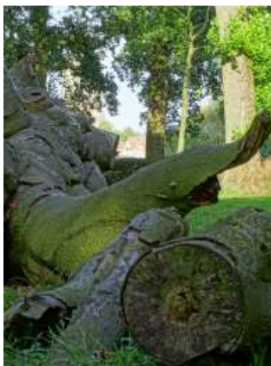
per ongeluk omgezaagde beuk, foto 2019