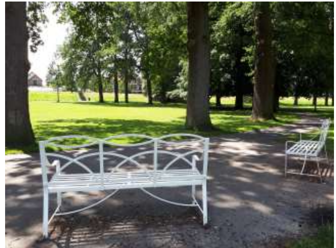
Bankjes bij de bomencirkel

Wibo zegt: 'Ik schreef 'Worpplantsoen' in de zomer van 2018 voor een optreden bij de Nering Bögel muziekkoepeel. Ik realiseerde me dat een plantsoen 's zomers op veel vrienden kan rekenen, maar los daarvan staat. Vriendschappen gaan misschien een leven lang mee, het Worpplantsoen eeuwen.'