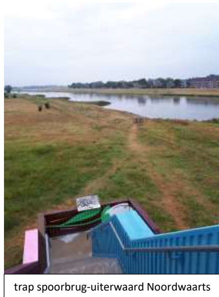
trap spoorbrug-uiterwaard Noordwaarts