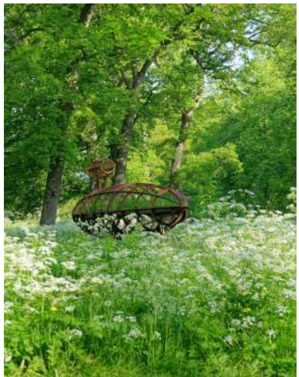
Worpscape, zomer 2021