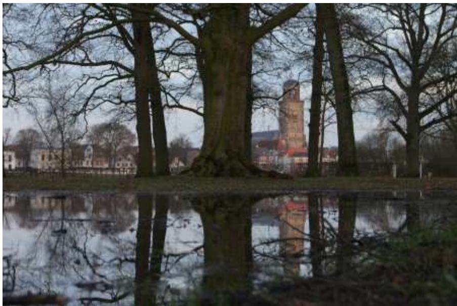
Intacte beuk 2013

Ik neem een stukje van je mee waar een specht in heeft gewoond terwijl de verslaggever op tv je onbedoelde neergang toont.