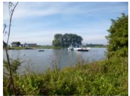
Pontje in de Nederrijn

Deze fietstocht leidt u langs een aantal typische landschappen van de regio. Nadat u de bosrijke Heuvelrug gepasseerd bent, steekt u bij Elst de Nederrijn over en rijdt u over de dijk met aan de ene kant uitzicht op de Betuwe en aan de andere kant de uiterwaarden van de rivier. Wanneer u bij Opheusden weer de pont neemt, fietst u langs de natuurgebieden de Blauwe Kamer en de Grebbeberg om vervolgens over een mooi fietspad langs de Grift de Gelderse Vallei in te rijden.