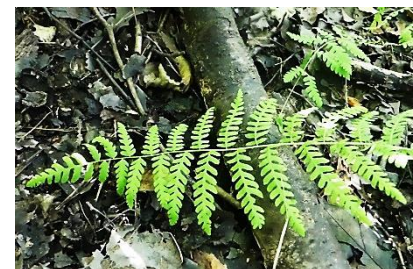
Foto 3. Blad

Heukels plaatst de plant in de Moerasvarenfamilie, verder in het geslacht Thelypteris en de soort Moerasvaren. In het geslacht Thelypteris worden verder geen andere varens vermeld.