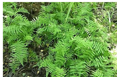
Foto 6. 'Warrige indruk'