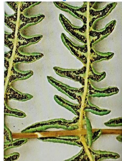
Foto 5. Fertiel blad