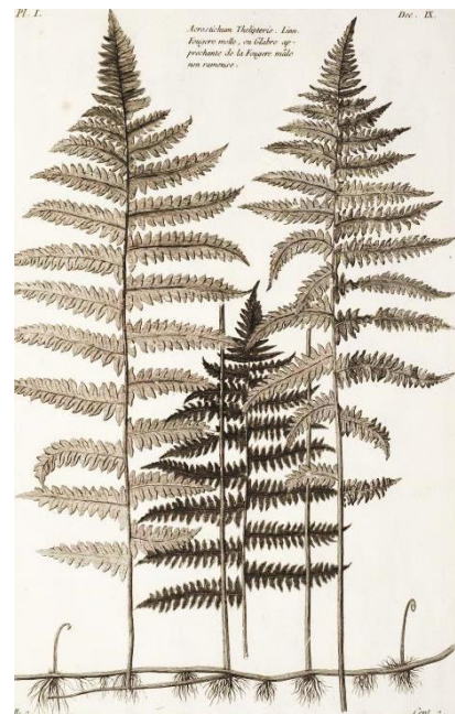
Afb. 2. Wortelstok

In het noorden van Overijssel kun je varenkenners ontmoeten die de plant de naam Addervaren geven.