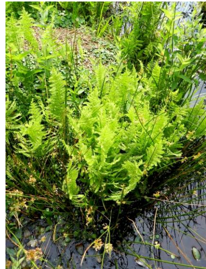
Foto 1. Moerasvaren