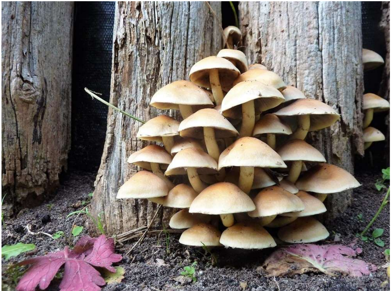
Gewone zwavelkop