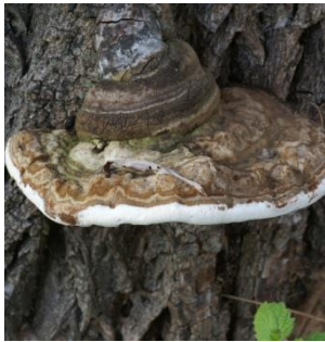
7. Platte tonderzwam