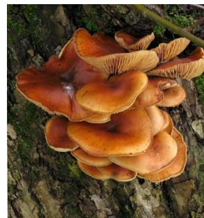
22. Fluweelpootje (gewoon)