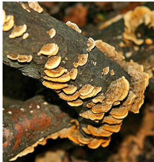
13. Gele korstzwam