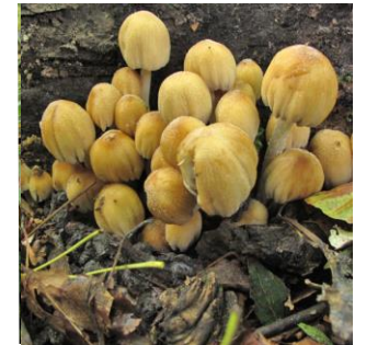
18. Inktzwam (glimmer)