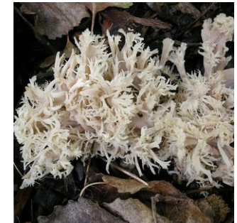
24. Witte koraalzwam