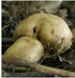
2. Aardappelbovist (kleine)