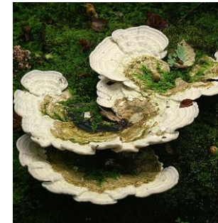
23. Witte bultzwam