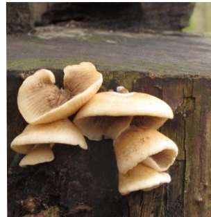
21. Week oorzwammetje