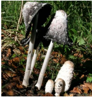
1. Inktzwam (geschubde)