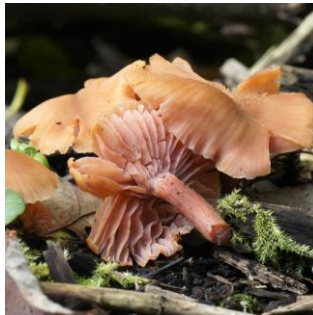
15. Fopzwam (gewone)