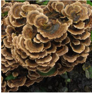
8. Gewoon elfenbankje