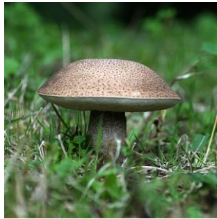
16. Harde populierboleet