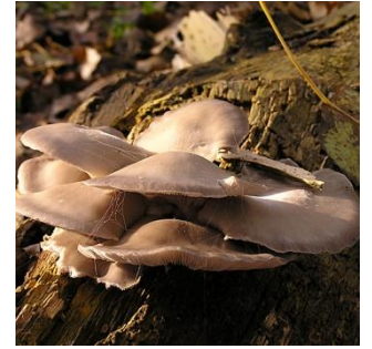
12. Gewone oesterzwam