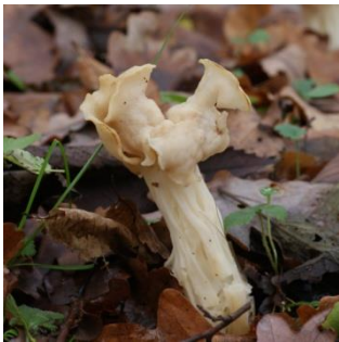
14. Witte kluiifzwam