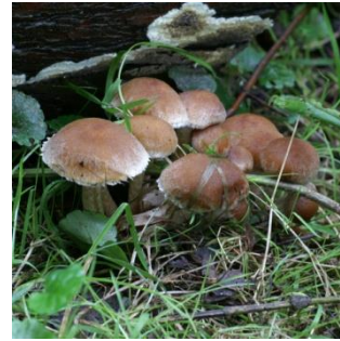
5. Tranende franjehoed