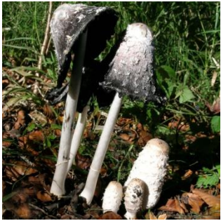
1. Geschubde inktzwam