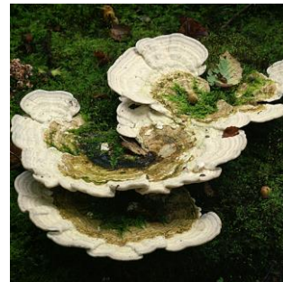
23. Witte bultzwam