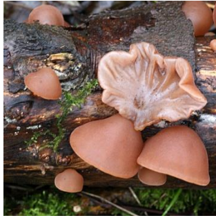
3. Echt judasoor