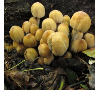
6. Inktzwam (glimmer)