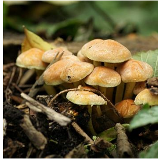
4. Gewone zwavelkop