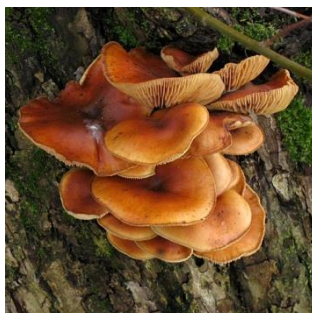
22. Gewoon fluweelpootje