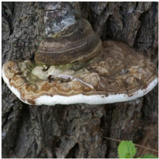
7. Platte tonderzwam