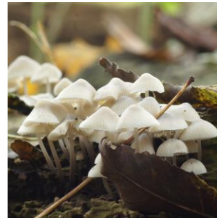
17. Mycena (bundel)