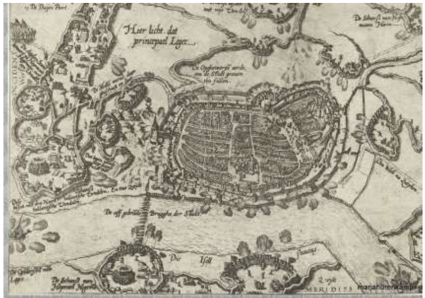
1578 Bolle Hoek tijdens beleg van Deventer (BGD)

Deze plek bij de twee bankjes heet "Bolle Hoek". Vroeger lag hier een verdedigingsschans.