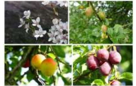
2019 Kerspruim bloesem en vruchten

Beide bomen vallen buiten het park, maar zijn te bijzonder om over te slaan.