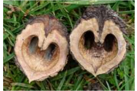
2019 zwarte noot doorsnede (JB)