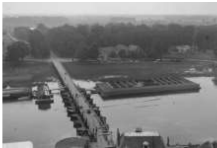
Na 1900 Schipbrug en zwembad (HIC-D)