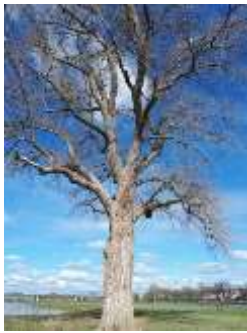
2019 bakenboom (MH)