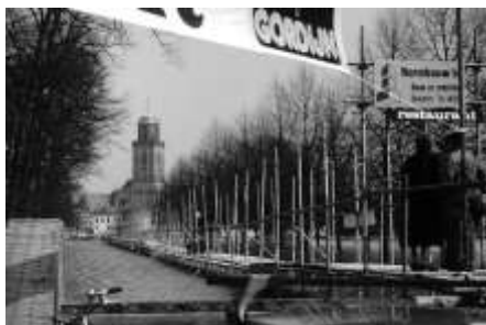
1988 hoog water (BGD)