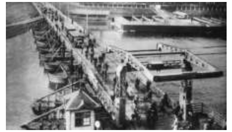
1930 Schipbrug met ophaalbrug (BGD)