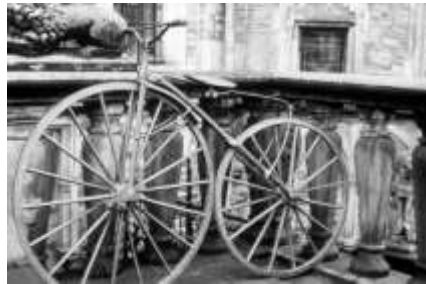
Vélocipède bij De Waag