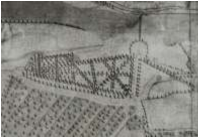
1727 Sterrenbos plattegrond (HIC-D)