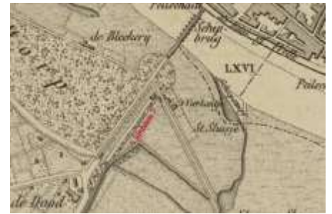
1840-1846 Eerste Rivierkaart (RWS)

Met de aanleg van de Schipbrug wordt de Avenue (nu Twelloseweg genoemd) een verbindingsweg tussen het westen (Holland-Utrecht-Amsterdam) en het noordoosten (Holten-Hamburg-Berlijn).