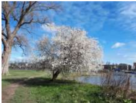
2019 Kerspruim en bakenboom (MH)