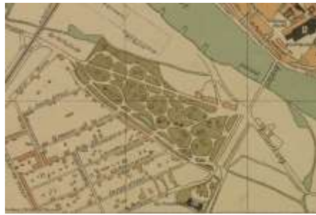
1911 stadsplattegrond (HIC-D)