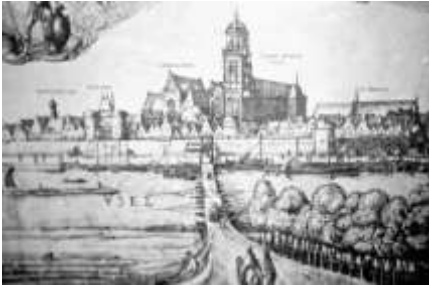
1616 Gezicht op de stad door Claes Jansz Visscher (BGD)