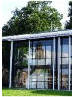
2019 IJsselhotel nieuwbouw (JB)

Reizigers uit het westen maakten gebruik van herbergen of logementen ingeval de stadspoorten al gesloten waren. Herberg “de Lange Brug” is een voorganger van het huidige IJsselhotel.