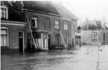
1926 Hoek Hovenierstraat (BGD)

In het eerste kwart van de 17e eeuw werd de verdedigingsgordel rondom Deventer versterkt om de stad te verdedigen tegen zwaarder geschut. De bewoners in de stad die daardoor hun tuin kwijtraakten werden gecompenseerd met tuinen/hoven aan deze kant van de IJssel. Vandaar dat dit gebied de naam De Tuinen, en later De Hoven kreeg.