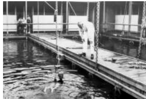
Zwembad les met de haak (BGD)

Wist je dat er een gemeentelijk zwembad in de IJssel lag van 1914 tot 1936?, “het IJsselbad”.