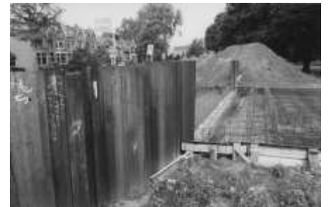
1995 aanleg coupure (HIC-D)

De Hoven kreeg in 1815 ontheffing van de Kringenwet. Dat betekende dat men met steen mocht bouwen. Er verrezen herbergen, sociëteiten en uitspanningen. Geleidelijk kwamen er ook meer woonhuizen.