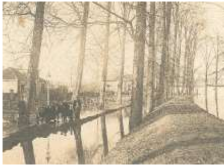
1920 hoog water (HIC-D)