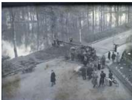
1920 Achter de Hoven (HIC-D)