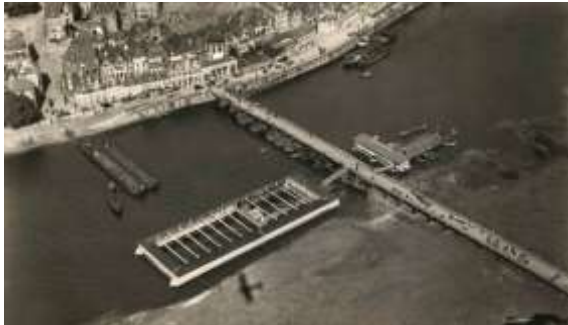
Luchtfoto schipbrug en zwembad