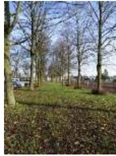
2019 dubbele lindenrij (MH)