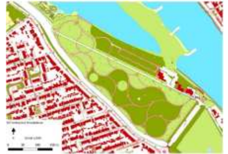
2019 plattegrond deventer

Zittend op het bankje kijk je voor je naar een rond veld omringd door bomen.