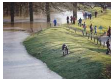
1993 december hoog water (MvL)

Maak bovenop de dijk een kijkronde over de omgeving: je ziet de spoorbrug, de natuurspeelplek Woeste Willem, de uiterwaarden, de nevengeul en de IJssel, het park en de woonwijk.