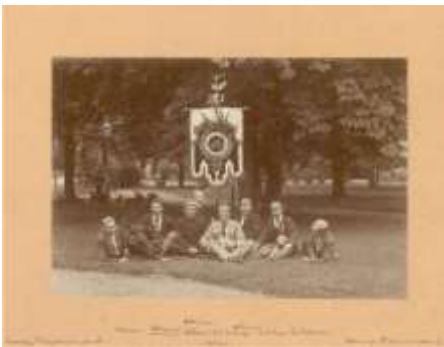
1892 Immer Weiter