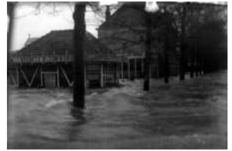
1926 Bloemisterijhuisje Ten Kate Twellose weg (HIC-D)