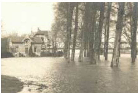
1920 Musis sacrum (HCI-D)