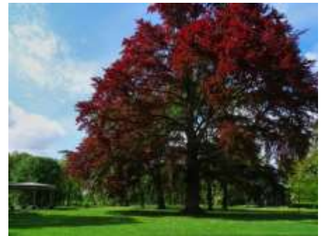
2019 Muziekkoepel en rode beuk (JB)

Geniet van een muzikaal optreden in de muziekkoepel op zondagmiddag (mei-september)!