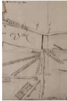
1799 Sterrenbos plattegrond (HIC-D)