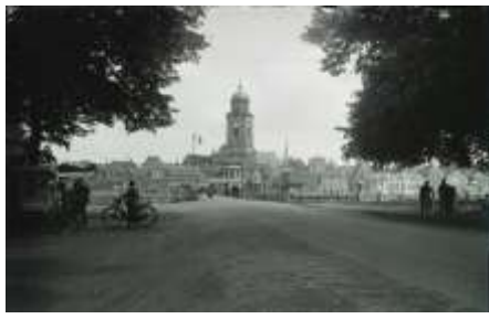
1930 Schipbrug met ijscokar (HIC-D)