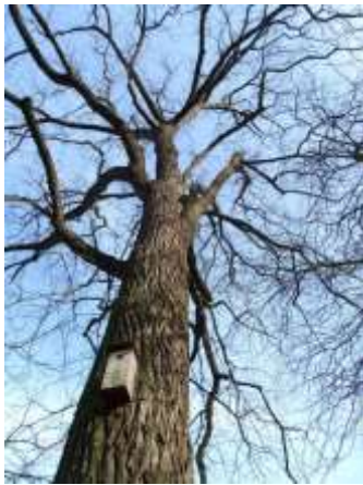
2019 Zwarte noot (MH)