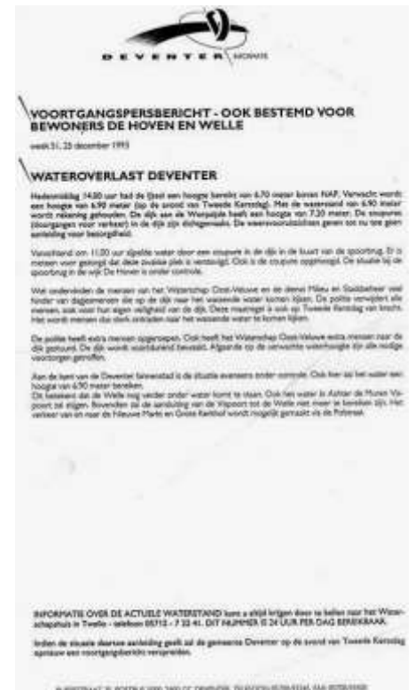
1993 eerste kerstdag wateroverlast Deventer

Neem een moment de tijd voor een blik over het park aan de ene kant en over de wijk aan de andere kant van de dijk.