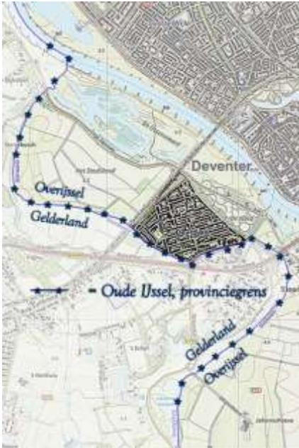
2019 Oude IJssel en provinciegrens