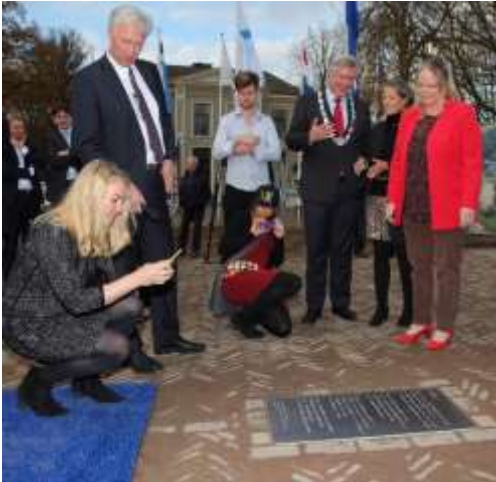
2015 november onthulling gedicht bij oplevering Ruimte voor de Rivier (EZ)

We hopen dat je van de wandeling hebt genoten.