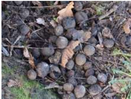
2019 zwarte noten (MH)