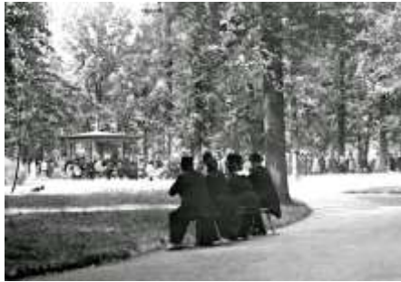
Vóór 1930, Muziekkoepel met kinderwagens (HIC-D)