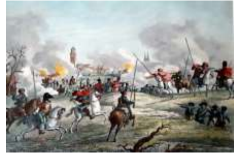
1814 Beleg van de Kozakken