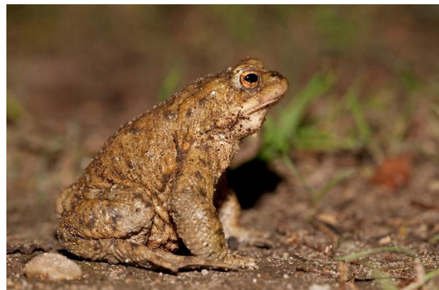
Gewone pad.

● Met name de omgeving van de paleisvijver is rijk aan amfibieën. Naast algemene soorten als bruine kikker , bastaardkikker en gewone pad is hier in 2013 ook nog de vrij kritische poelkikker waargenomen. Het ging om in totaal 3 locaties en maximaal zo'n 40 dieren. Onderzoeker Van der Helm trof in 2011 en 2012 ook heikkickers aan in de Paleistuin en stelde voortplanting vast in 2013 in een kwelsloot in de Jachtweide. Het ging vermoedelijk om restpopulaties die na deze jaren helaas niet meer zijn vastgesteld. Het