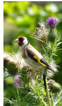
Distel met putter.