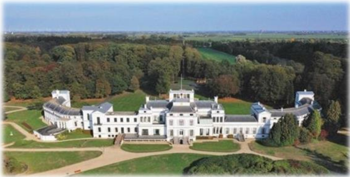
Paleis Soestdijk. Het huis in het midden heet Corps de Logis. Links de Soester vleugel, rechts de Baarnse vleugel. Het huis dateert van 1650, de vleugels zijn in 1822 aangebouwd.