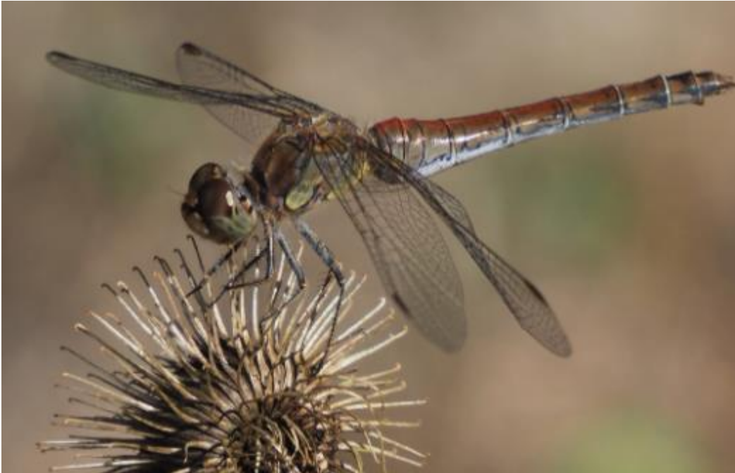
Bruinrode heidelibbel.

● Het plangebied is niet bijzonder rijk aan dagvlinders : 20 in hoofdzaak algemene soorten in kleine aantallen. Het ontbreken van voldoende nectarplanten wordt als een belangrijke oorzaak genoemd van de beperkte soortenrijkdom.