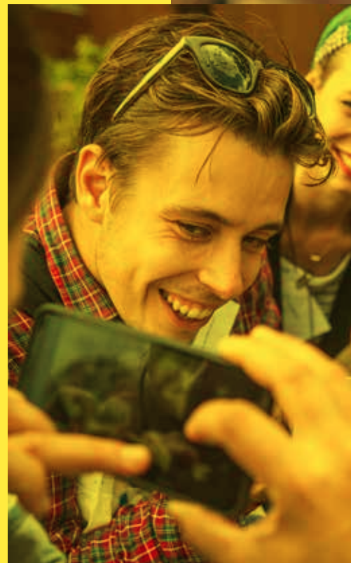
OP SAFARI IN DE DIGITALE WILDERNIS, TRAINEES ONDERSTEUNEN VRIJWILLIGERS IN DEZE DIGITALE WERELD