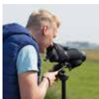
VOGELS KIJKEN OM DAARNA MET ELKAAR EEN VOGELCURSUS TE ONTWERPEN