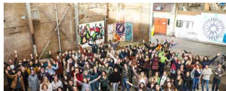
AL 225 TRAINEES DEDEN MEE MET HET GROEN TRINEESHIP