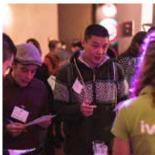
NETWERKEN IS ERG BELANGRIJK