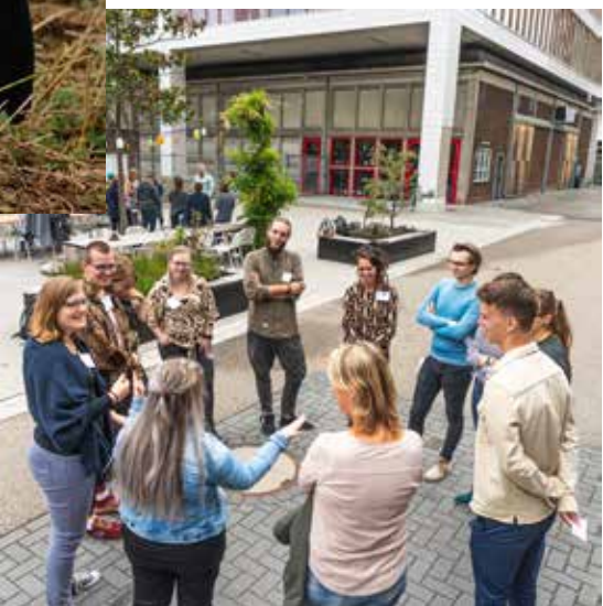
VERSTERK HET SOCIALE COMPONENT MET TEAMBUILDING