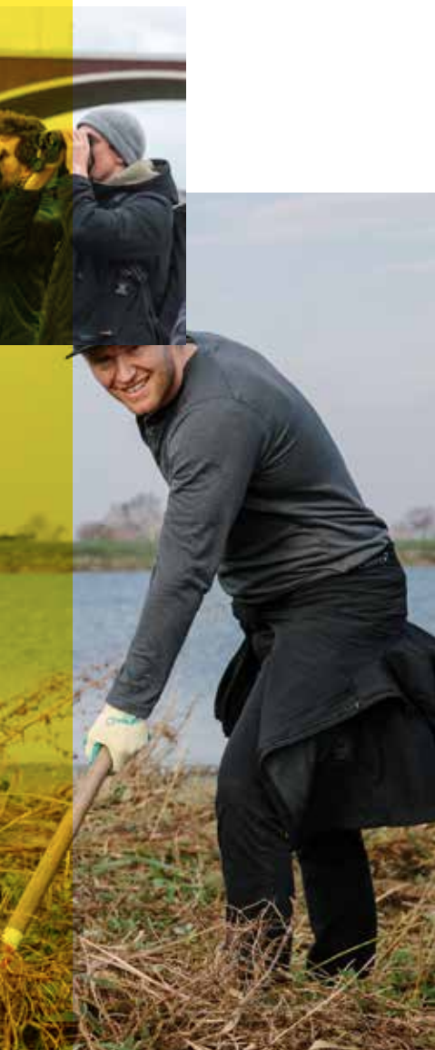
TRAINEES VOEREN NATUURWERK LIT EN VERZINNEN EEN JONGERENCAMPAGNE