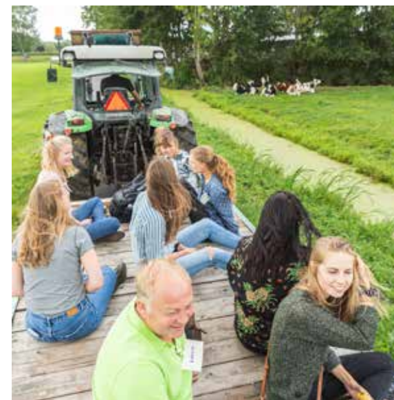
TRAINEES MAKEN KENNIS MET BIOLOGISCH BOEREN