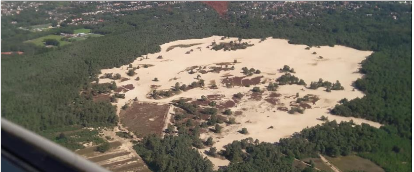
De Lange Duinen in Soest gezien vanuit een zweefvliegtuig.