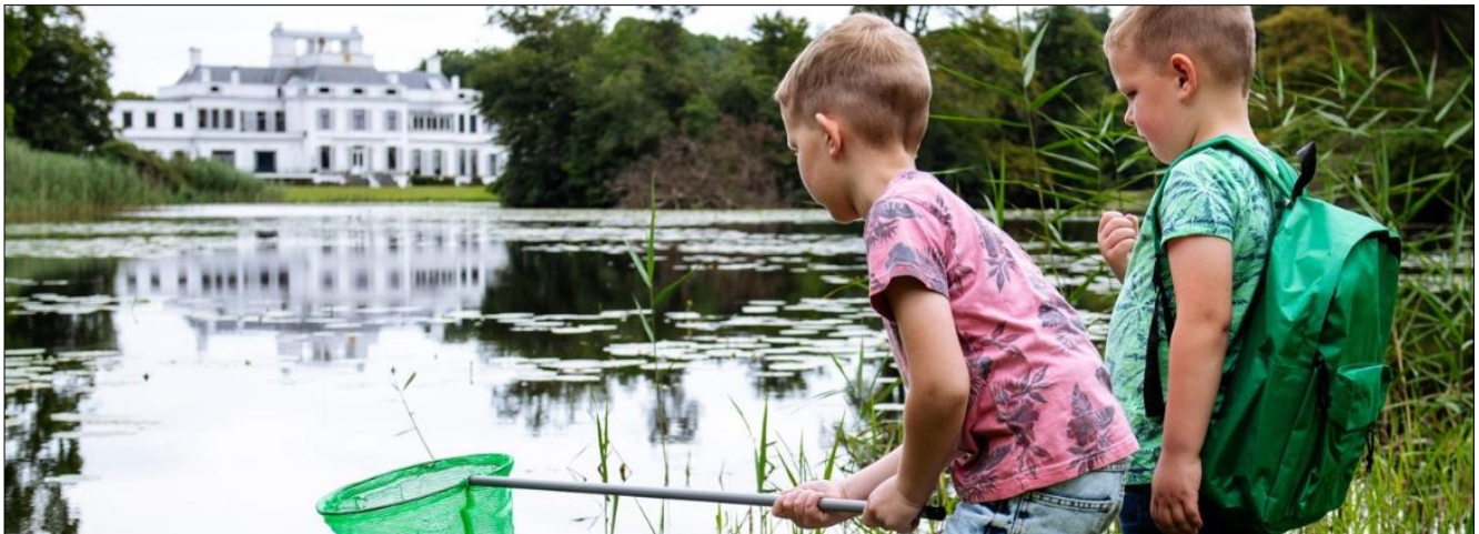
Het IVN gaat samenwerken met Paleis Soestdijk (zie verder in deze nieuwsbrief). Foto Paleis Soestdijk