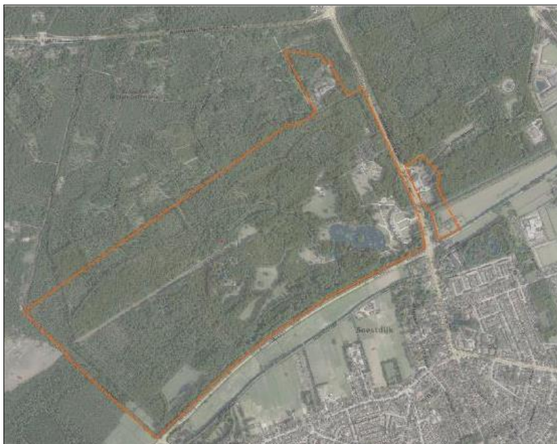
Het oranje omrande gebied betreft het Landgoed Paleis Soestdijk.