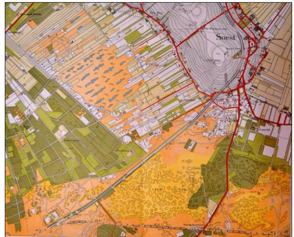
Soest op een kaart uit de jaren 30. Smitsveen en Overhees bestonden toen nog niet.