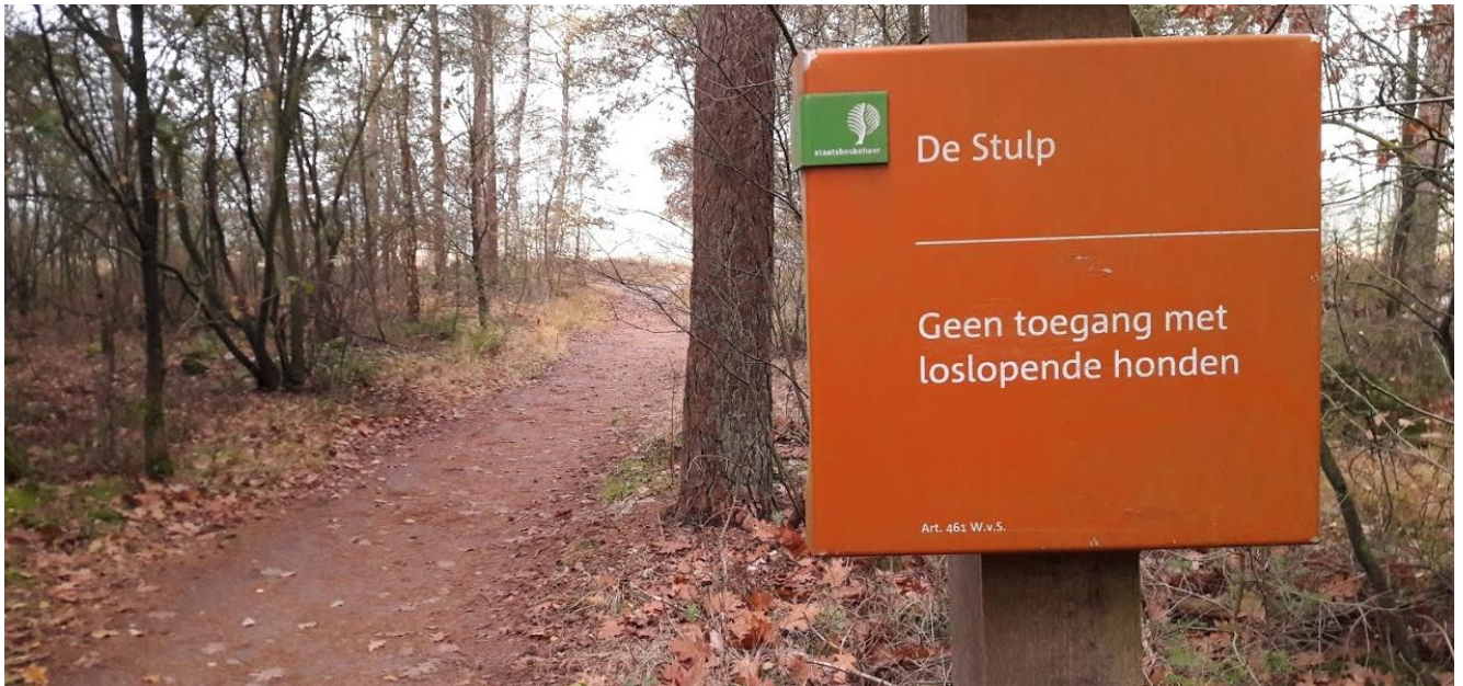
Overgang van de bossen van Landgoed Pijnenburg naar De Stulp van Staatsbosbeheer.