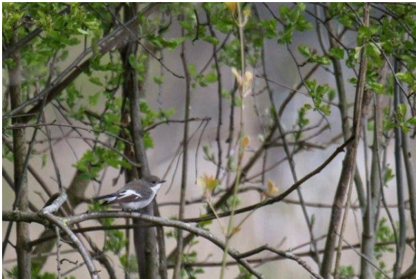
Bonte vliegenvanger (Auke Lever)

Een fraai gekleurd mannetje gekraagde roodstaart werd gefotografeerd bij het Spookverlaat.