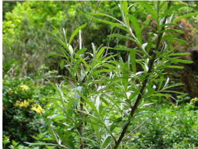
Links kardinaalsmuts, rechts duindoorn

Hulst heeft tot twee meter hoog stekelig blad, waarschijnlijk tegen vraat, want daarboven is het blad ongestekeld. Niet-inheemse struiken en bomen: Anna Paulownaboom (genoemd naar de vrouw van Willem II) met lila bloei voordat het groot zacht blad verschijnt, boerenjasmijn, deutzia, grote bergthee, rododendron en duivelswandelstok.