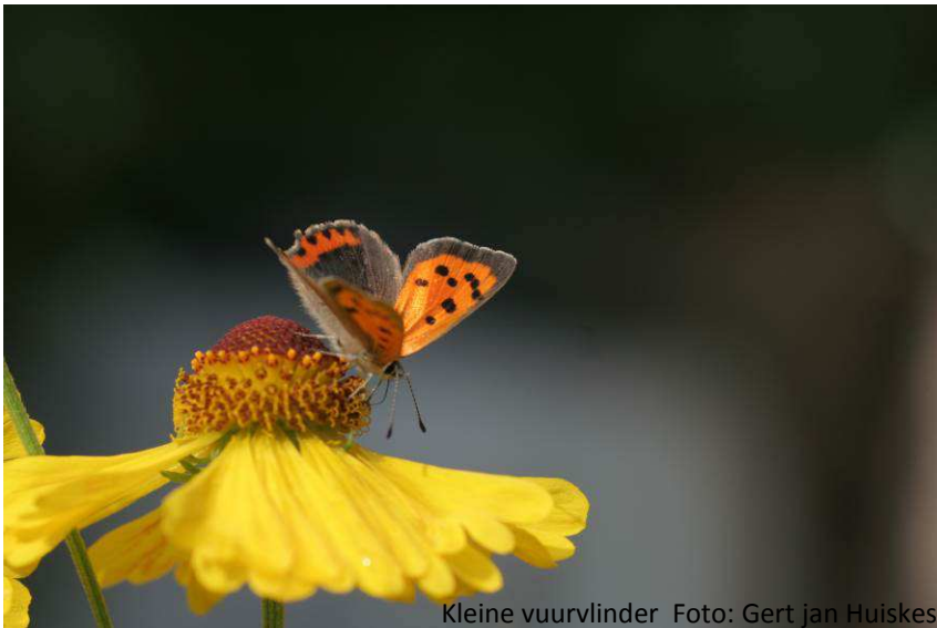
Kleine vuurvliinder

Zaterdag 25 jan Wintervoedselveldjes in Noord Groningen