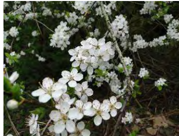
Foto links kerspruim, rechts bloei

Het Amerikaans krentenboompje, in de heemtuin forse struiken, in april voor het blad opvallende bloei (wit), het blad loopt rood uit, de spitse knoppen zijn onder rood, boven groen. Ook de zwarte appelbes komt uit Amerika, het is een kruising van twee soorten. Mispel, vanaf het steigertje kan je in mei de mispels zien bloeien. We kregen ze als entboompjes, doch intussen zijn het grillige struiken geworden. Dwergmispel (Cotoneaster), er staan hier grootbladige struiken en een kleinbladige vlakke dwergmispel, die je in de stad wel veel als bodembedekker tegenkomt, beiden zitten in het najaar vol rode besjes. We hebben nog twee struikvormige kweeperen, deze hebben jaarlijks veel te lijden van rupsjes en willen maar niet groeien. Lijsterbes, evenals es samengesteld onevengeveerd blad, schermvormige bloei wit, bes rood, hier vrij veel last van honingzwam. Meidoorn, de eenstijlige (alg.), de tweestijlige (zeldz. op de hoge zandgronden). We hebben vorig jaar drie tweestijlige geplant maar er kwam dit jaar geen blad aan. Nog afwachten, het kan heel goed dat ze komend jaar toch nog aanslaan. Appelbomen doen het erg slecht, stoofperen zijn gestolen. Kornoeljefam. Er zijn ruim 50 soorten, alleen de rode kornoelje is inheems. Veel aangeplant worden de witte kornoelje, de gele kornoelje,