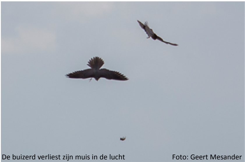
De buizerd verliest zijn muis in de lucht