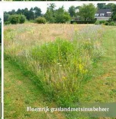
Bloemrijk grasland met sinusbeheer