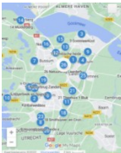
26 Natuurbrug Laarderhoogt