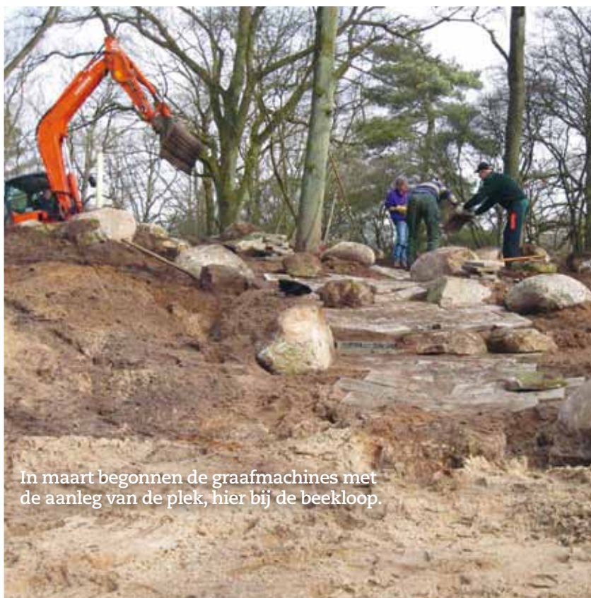
In maart begonnen de graafmachines met de aanleg van de plek, hier bij de beekloop.

Christine: 'Dit was een netjes aangeharkt bos, een beetje saai, maar wel met grote bomen die we konden omtrekken.'