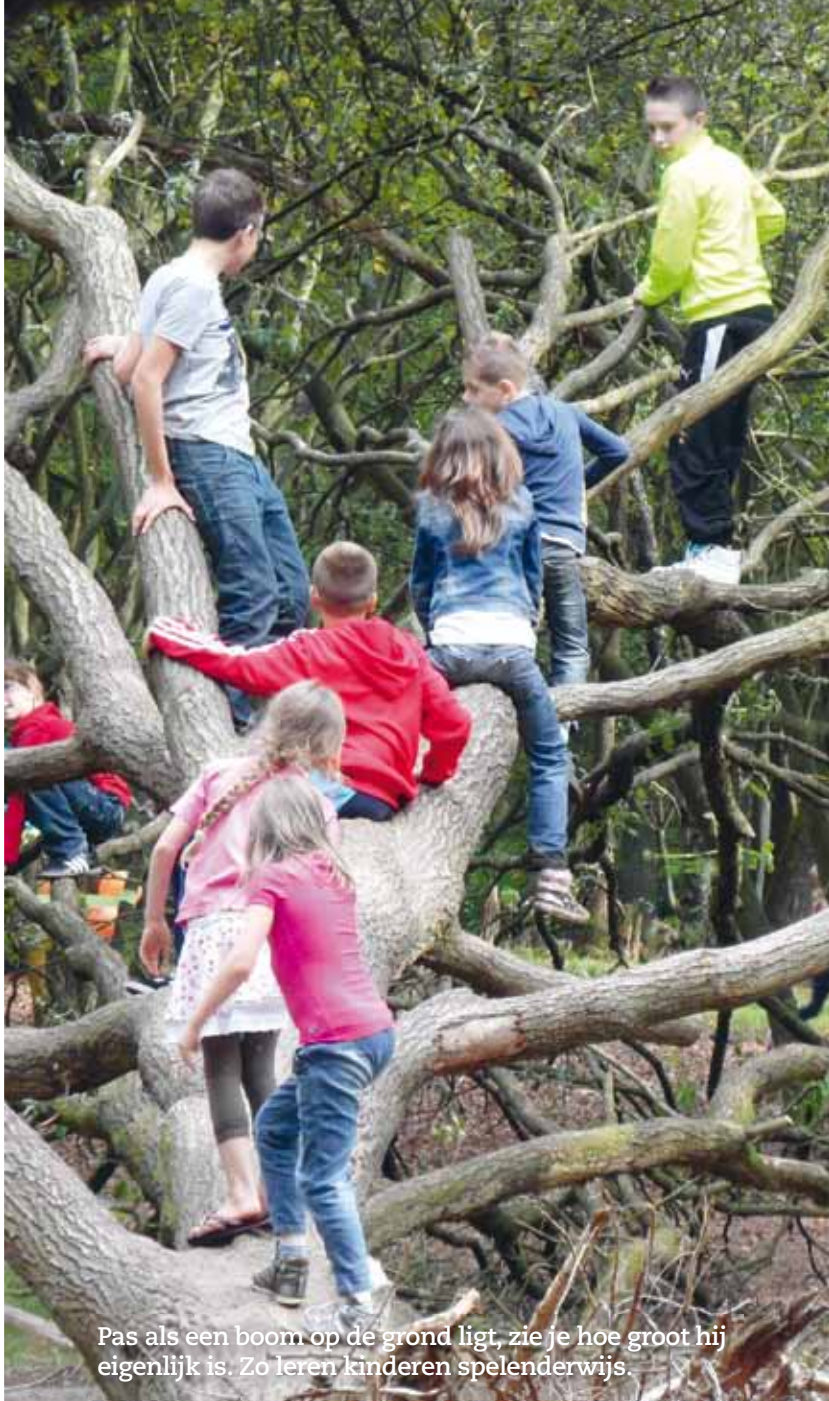
Pas als een boom op de grond ligt, zie je hoe groot hij eigenlijk is. Zo leren kinderen spelenderwijs.