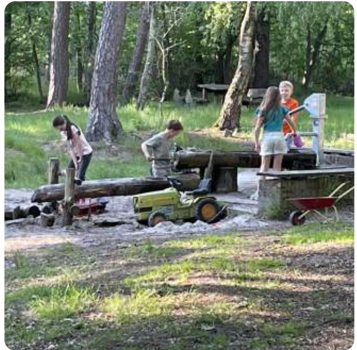
Spelen met water