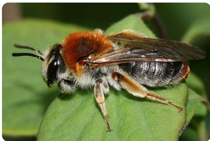
Roodgatje nestelt in zanderige bodems

Een nuttige vorm van nesthulp bestaat uit het aanbieden van nagebootste vraatgangen in hout. Een positief effect van het aanbieden van deze vorm van nesthulp is, dat mensen (en in het bijzonder kinderen) insecten in hun activiteiten goed kunnen bekijken. Juist deze mogelijkheid