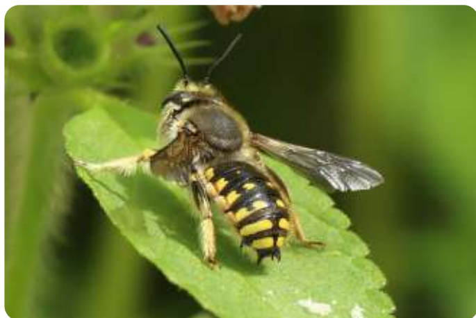
De wolbij nestelt graag in oude nestgangen van andere wilde bijen

Bovengrondse nesten: van de solitaire bijen inclusief hun koekoeksbijen maakt ongeveer 10% (om en nabij 35 soorten) gebruik van boorgangen. Al gauw verdubbelt dit aantal als alle vormen van nesthulp worden toegepast die hierna besproken worden, dus inclusief vermolmd hout en steile wandjes van zand. Voor solitaire wespen komen we makkelijk op meer dan 60 soorten.