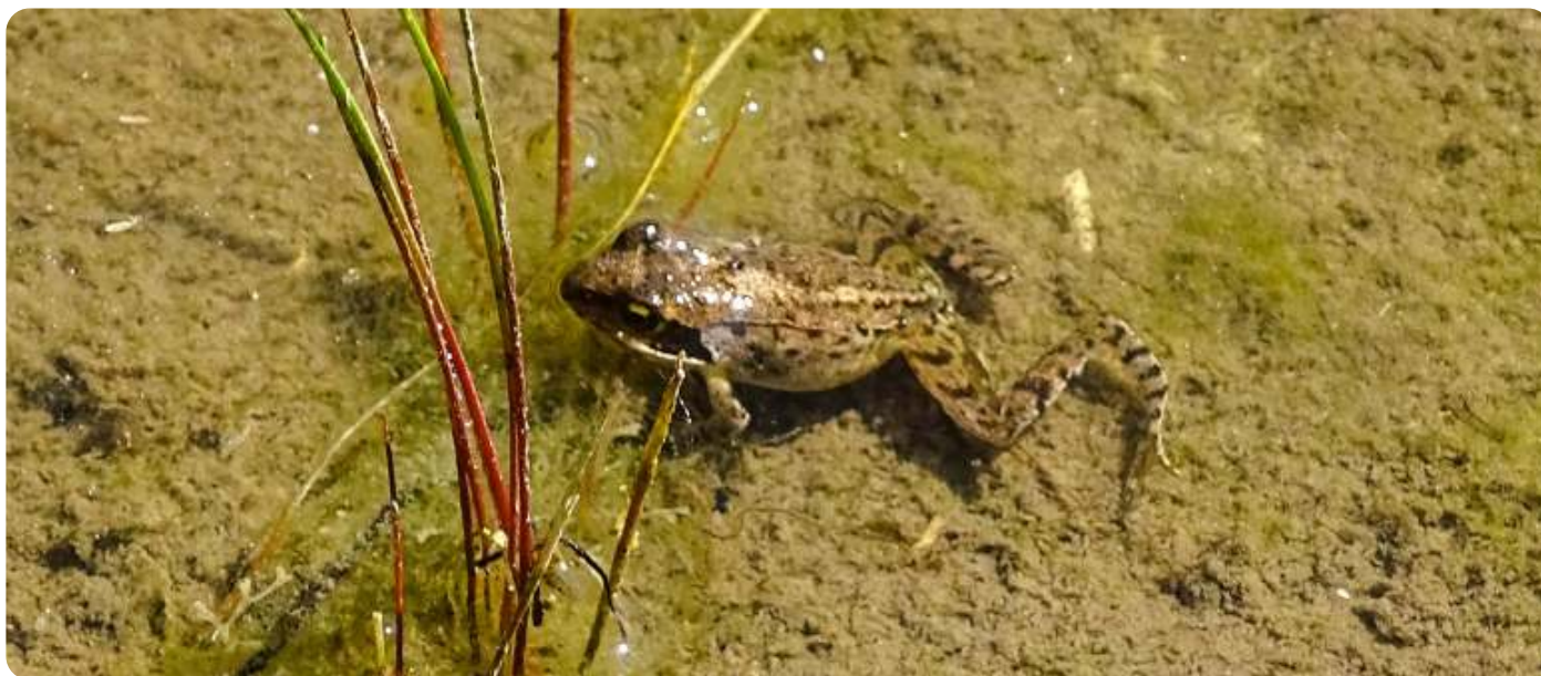
Bruine kikker

De voorzitter bedankt de aanwezigen en sluit om 21.40 uur de vergadering. Hij nodigt iedereen uit om nog even na te praten met een hapje en een drankje.