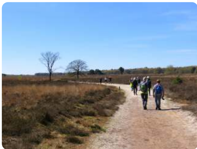
Door de heide