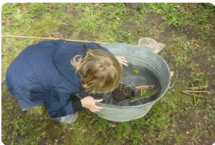
Kikkerdril kijken

Een prachtige dag was het, 12 april, om kleine en grote bezoekers te ontvangen in het Heempark. Na binnenkomst stonden ze meteen oog in oog met egel , mol en bever . Vooral bever met zijn stevige houding en zijn lengte van 1.30 m, dat is inclusief zijn forse staart. Zo lang zijn de meeste kinderbezoekers nog niet. Dat maakt wel indruk!