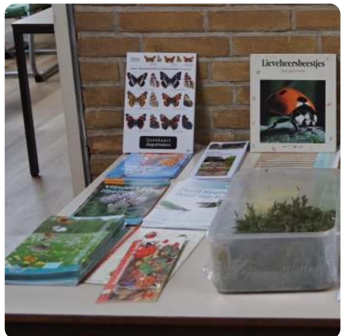
Info vlindertuin

Wilt u meer weten over de tuin of ons helpen, neem dan contact op met leaseuntjens@gmail.com