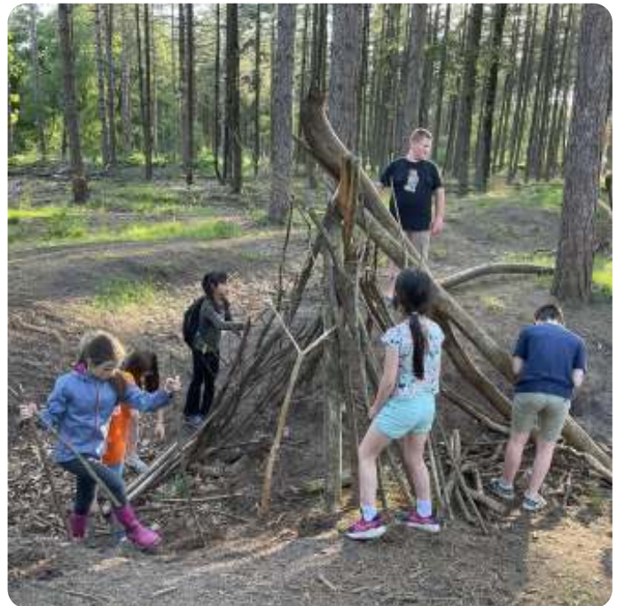
Samen een hut bouwen