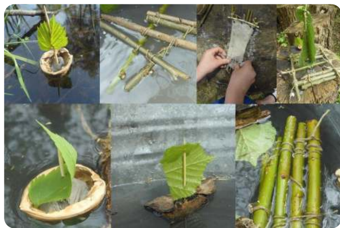
Zelf bootjes maken net als Bever

Dan gaan de kinderen zelf aan de slag. Wat kunnen jullie bouwen een klein bootje of een groot vlot? Takjes, touwtjes, notendopjes er ligt van alles klaar, bouwen maar! Er wordt geknutseld en gebouwd, papa's mama's helpen mee, en blijven de bootjes drijven? Kijk maar... Tijd voor een drankje en een hapje en voor de drie vriendjes maken de kinderen nog een mooie tekening. En wellicht tot de volgende keer, dat is in de zomer, zondag 28 juni.