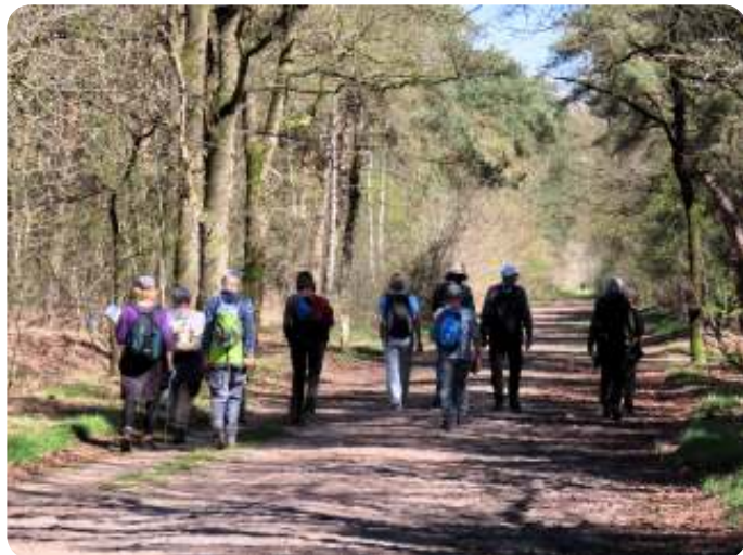
Door bossen

Door de stenige ondergrond is dit gebied nooit ontgonnen.