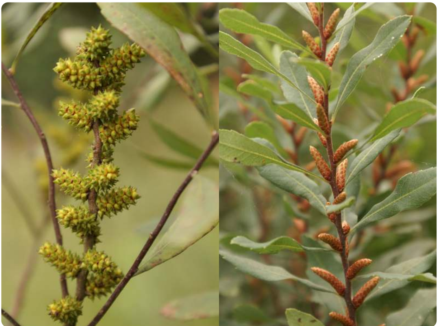
Gagel, links de mannelijke plant en rechts de vrouwelijke plant

Vervolgens verlaat je de hei en loop je nog steeds zuidwaarts op het zandpad met het fietspad totaan de verharde weg. Ga naar Borkel. Hier is altijd wel horeca geopend. Na de pauze ga je door de Sportparkdreef en kom je bij een zandpad dat naar de Dommel loopt. Volg de Dommel aan de westzijde totaan de instapplaats voor kanoers. Ga rechts over de drukke weg totaan de bosrand, waar je weer rechts gaat. Slinger over enkele zandpaden naar het noorden. Kruis de Dorpsstraat en ga aan de bosrand de Malpie weer in. Steeds rechtdoor tot je op een T splitsing rechts en de eerste links gaat. Weer een stuk verder even links en weer rechts. Links van je ligt een open veld. Hou het veld links van je tot je in de noordelijke punt naar rechts gaat en het bospad een tijd volgt. Je komt weer op de heide. Na 300 meter ga je rechts een paadje in dat de heide doorkruist. Dit is ook het Vennenpad, het Airbornepad en het Pieterpad. Ja, de IVN wandelingen bevinden zich op niveau. Na dit pad kom je terug bij het fietspad en steek je over naar het pad dat je eerder al hebt gelopen, richting parkeerplaats. Veel plezier, vooral het stuk over de hei en langs de Dommel bij Borkel zijn mooie gedeeltes.