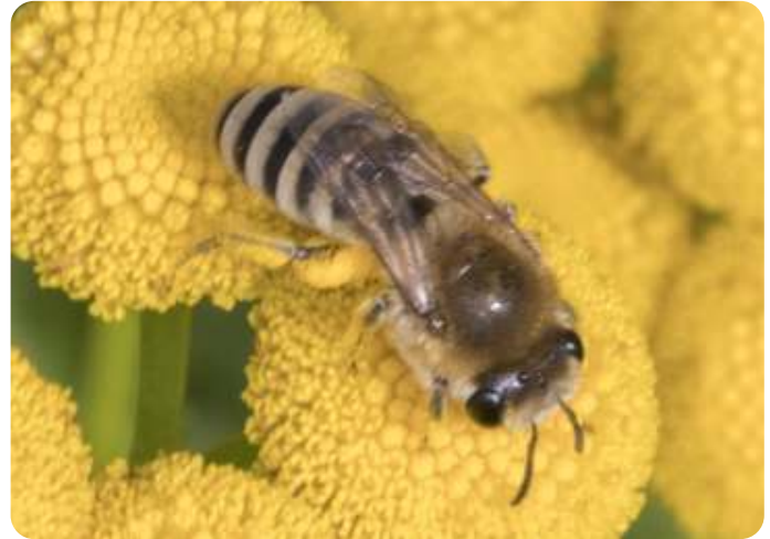
De wormkruidbij nestelt in steilwanden