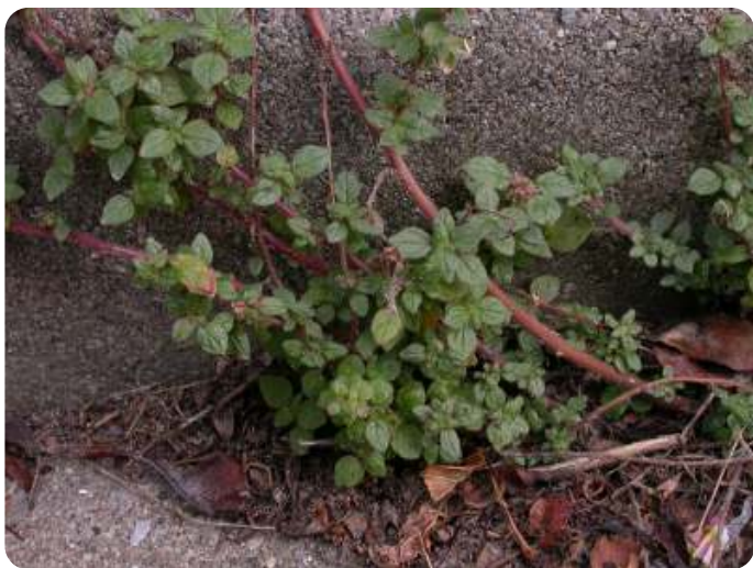
Klein Glaskruid