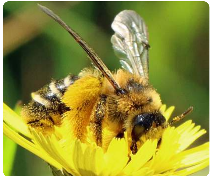
De pluimvoetbij graaft nesten vooral tussen stoeptegels