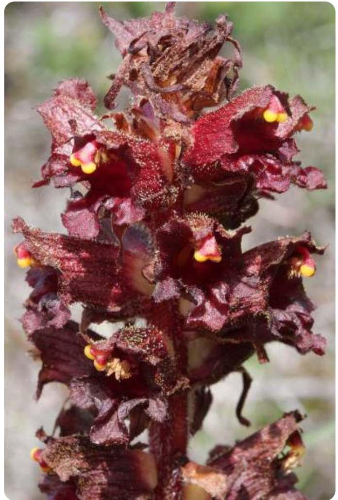
Klimopbremraap