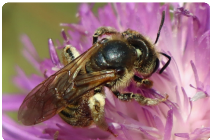
De breedbandgroefbij nestelt ook in steilwanden maar ook in leemhoudende grond