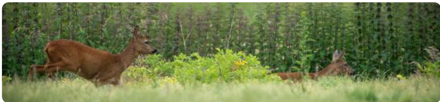
Reeën in Oerle