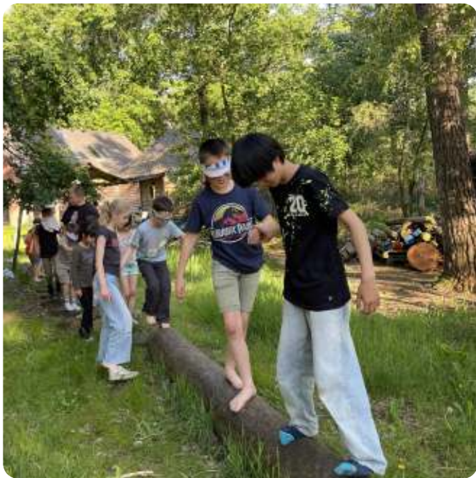
Je moet elkaar wel vertrouwen

De waterpomp lokte, dus besloten we het laatste kwartier nog even in de zandbak met auto's en traktoren én waterpomp te spelen. "Waarom maar zo kort, anders doen we toch ook 2 uur?" Dat was wel het bewijs dat deze activiteit goed in de smaak viel. Moe maar voldaan en lekker vies stapten ze weer in de auto's.