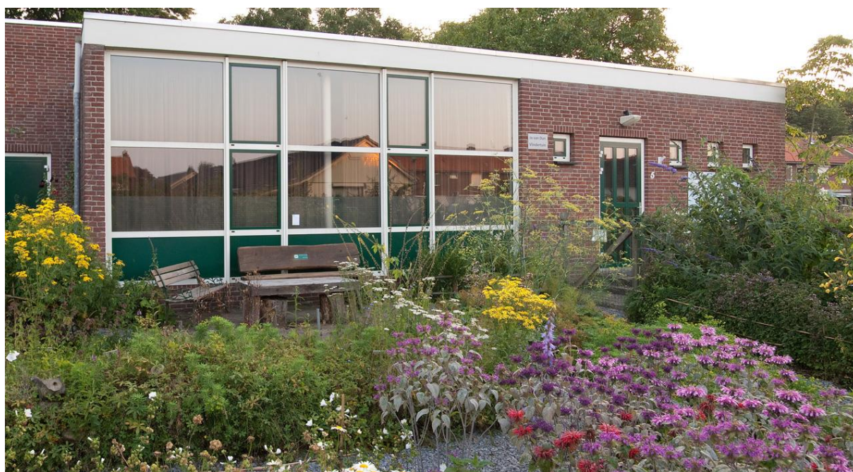
Verenigingsgebouw "D'n Aard" met omliggende Jo van Dun vlindertuin

Om het vele werk beter te kunnen uitvoeren en voor te bereiden is er in de afdeling een aantal werkgroepen ingesteld, die elk op hun manier een bijdrage leveren aan de natuur- en milieueducatie. Sommige doen dat direct gericht op één van de doelgroepen: jeugd, publiek of overheid & organisaties, andere hebben een meer ondersteunende of interne functie.