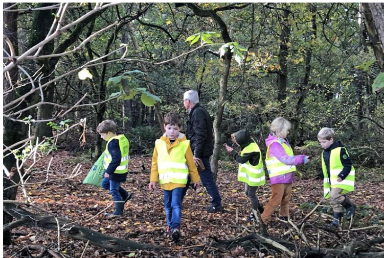
Herfstwandeling met basisschoolleerlingen

In plaats van een bijeenkomst in maart, hebben we de scholen uitgenodigd voor een activiteit in park 'De Vogelzang'. De bedoeling was algemene vaardigheden aan te reiken om met een groep kinderen in de naastliggende natuur 'leuke dingen' te gaan doen. Helaas was voor deze activiteit geen belangstelling. Als voorjaarsproject hebben we het project 'Lieveheersbeestjes' aangeboden aan groep 1 t/m 4. Voor groep 5 t/m 8 was er de tentoonstelling over 'De Eik'.