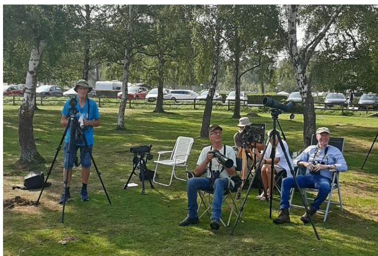
Speuren naar roofvogels op trek in Falsterbo, Zweden

De excursies kun je verdelen in dagexcursies die verder weg zijn of halve dag excursies, waarbij we rond 14 uur stoppen. Een greep uit de doelen: de Biesbosch, Zeeland, verschillende plekken in Zuid-Limburg, Kraaijenbergse plassen bij Grave, Ameide aan de Lek, Bossche Broek, Callantsoog in Noord-Holland en ook Tholen in Zeeland voor een grote variatie aan steltlopers. In mei genoten we van een lang weekend in het Lauwersmeer, met 8 deelnemers en aan vogels o.a. grauwe kiekendieven en veel steltlopers aan de Waddenkust. Voor degenen die wat langer van huis weg kunnen, bleek zuid Zweden een mooi doel voor een week in september, met 6 deelnemers. We zagen er ongekend veel roofvogels.