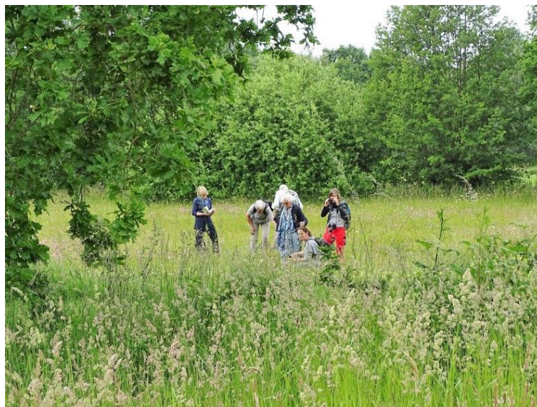
Tussen de orchideeën in de Wijstgronden

Van de meeste wandelingen is een verslag gemaakt dat in het Praatkruid terug te vinden is. Tijdens de wandelingen worden alle planten die we tegenkomen gedetermineerd en thuis worden de inventarisatielijsten (Nederlandse en wetenschappelijke naam) uitgewerkt. De waarnemingen worden doorgegeven aan FLORON en de NDFF Verspreidingsatlas. De activiteiten van de plantenwerkgroep worden aangekondigd in de maandelijkse nieuwsbrief, zodat ook andere IVN-leden kunnen kennismaken en aansluiten..