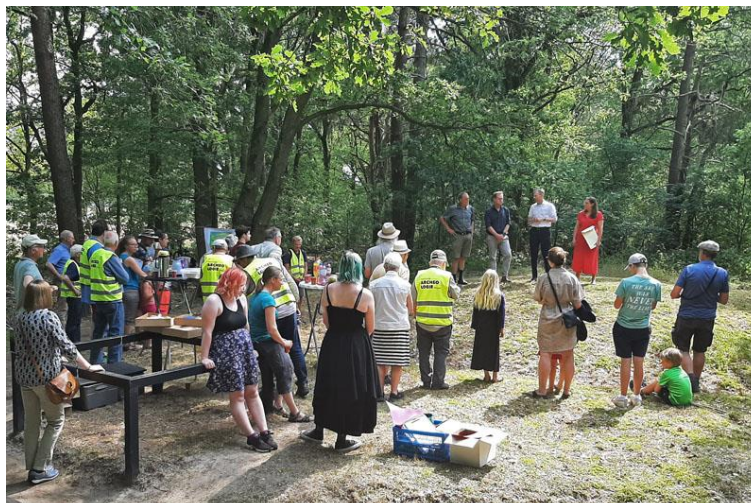
Een beeld van de Archeologiedag in Knegsel

Het uitstapje was dit jaar naar het EDAH museum in Helmond.