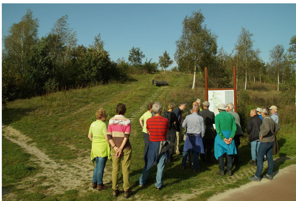
Enkele impressies van de jubileumviering in Park Meerland