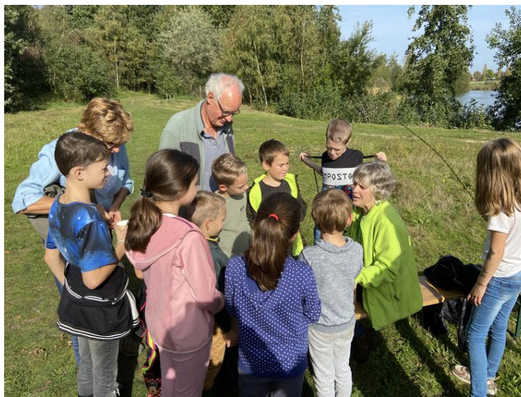
Jeugdleden krijgen uitleg over bodemdieren

Het is een afwisselende groep, met uitbundige, maar ook heel rustige kinderen. Voor de laatste groep vormt het jeugd-IVN een leuke plek waar geen groepsdruk aanwezig is en ze zichzelf kunnen zijn.