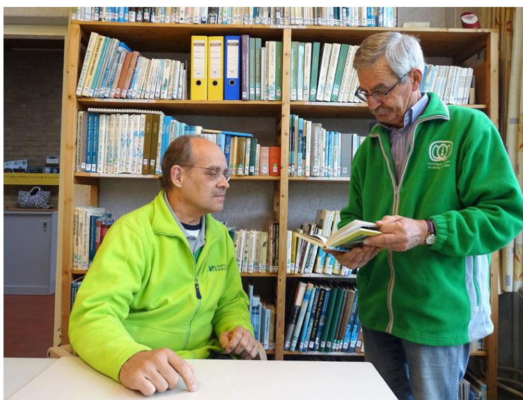
De “boekenwormen” aan het werk

Evenals de voorgaande jaren heeft de werkgroep de bibliotheek gecontroleerd op de aanwezigheid van de in ons bestand opgenomen boeken. Verder hebben we een aantal nieuwe boeken, werkstukken en andere documenten in de bibliotheek opgenomen.