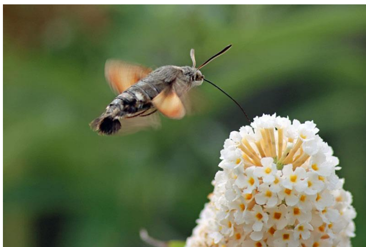
Kolibrievlinder aanwezig in de Jo van Dun vlindertuin

In 2023 hebben we geen inventarisatie project gehad voor onze groep. Hierdoor zijn we niet wekelijks samen gaan inventariseren. Daarnaast zat het weer in 2023 absoluut niet mee. Voor het inventariseren van insecten in de natuur hebben we droog, windstil, licht of onbewolkt weer met een temperatuur van meer dan 19 °C nodig. Volgens het KNMI viel in de lente de meeste neerslag in Eindhoven, 275 mm (normaal 149 mm)!