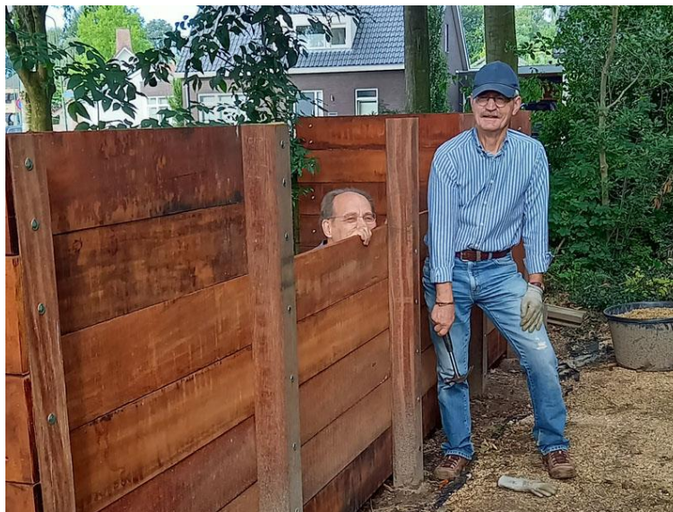
De nieuwe bak voor tuinafval in de maak