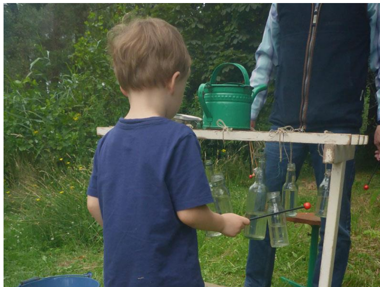
Muziek maken op een waterorgel, wat een belevenis!

In de zomer tingelde en tangelde 't waterorgel aan de Dommel de hele dag door, wat een prachtige 'water-music', het zwanenmeer is er niks bij! Heel veel kinderen hingen de zwembroeken-was op voor Pad en de vlonder was af en toe te klein voor alle schepnettertjes (circa 138) die het heempark bezochten! Met een beetje passen en meten konden we allemaal genieten van de jonge salamandertjes, bootsmannetjes en weten we nu ook dat alle libellenkinderen onder water leven!