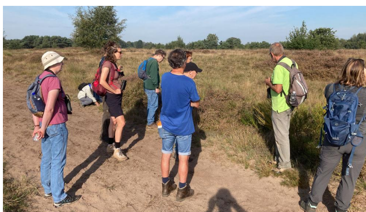
Een docent geeft uitleg tijdens één van de excursies

Deze regionale cursus is weer aangeboden door de 5 samenwerkende afdelingen Bergeijk-Eersel, Cranendonck, Kempenland-West, Valkenswaard-Waalre en Veldhoven Eindhoven Vessem. Er deden 34 mensen aan mee die allen een bewijs van deelname hebben ontvangen. De cursus omvatte 6 avonden theorie en 6 buitenexcursies. Op het einde van 2023 is weer gestart met de voorbereiding van een cursus in 2024. Er is veel belangstelling voor.