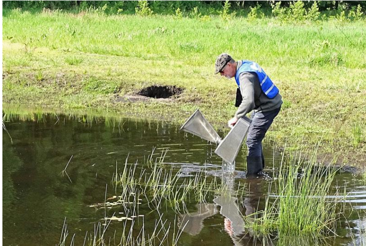
Een val voor amfibieën wordt uitgezet in een poel

Dit jaar begonnen met het gebruikelijke poelenrondje, waarbij 5 nieuwe poelen langs de Beekloop bij Westerhoven werden bezocht, ter voorbereiding van het monitoren. In de periode van april tot en met juni zijn we bijna wekelijks op pad geweest om voor Natuurmonumenten 15 poelen te inventariseren, op salamanders en ander waterleven, oeverplanten en insecten. Dit gebeurde bij Westerhoven, Borkel en Schaft en de Malpie. De Alpenwater-, kleine water- en kamsalamanders zijn ook nu weer waargenomen.