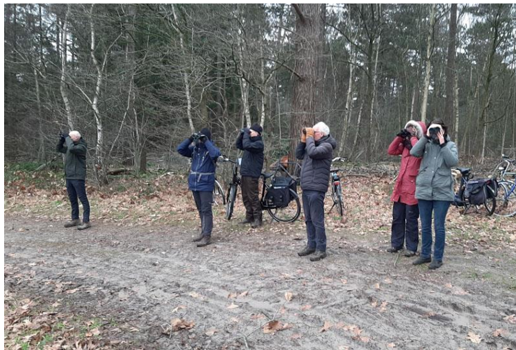
Geen tijd voor een winterstop: PTT telling Buikheide

Eens per jaar houden we een gemeenschappelijke avond waar we de resultaten met elkaar delen en het programma voor het volgende jaar bespreken.