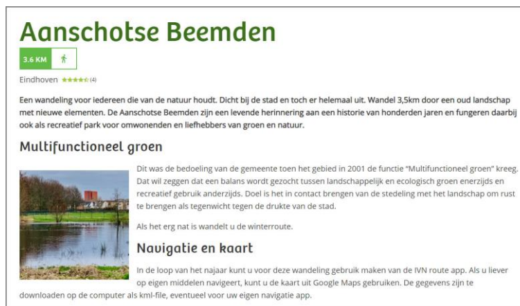
Een screenshot van een wandelroute

De IVN app is vernieuwd. Dit heeft in het algemeen voor de afdelingen in den lande extreem veel werk opgeleverd. Doordat de moeilijkheid van een route app gigantisch onderschat is, is de overgang uiterst moeizaam geweest en voldoet de nieuwe app op vele punten nog niet aan de verwachtingen. Wandelaars hebben er de facto niet veel aan. Vandaar dat er gekozen is om voor alle routes ook een Google Maps kaartje en/of een routebeschrijving met kaartje op de site te zetten.