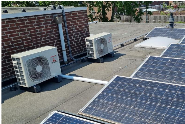
Enkele buitenunits van de airco's en zonnepanelen op het dak

worden gegevens t.a.v. gasverbruik en electra-opwekking en -verbruik nu wel wekelijks verzameld en t.z.t. geanalyseerd.