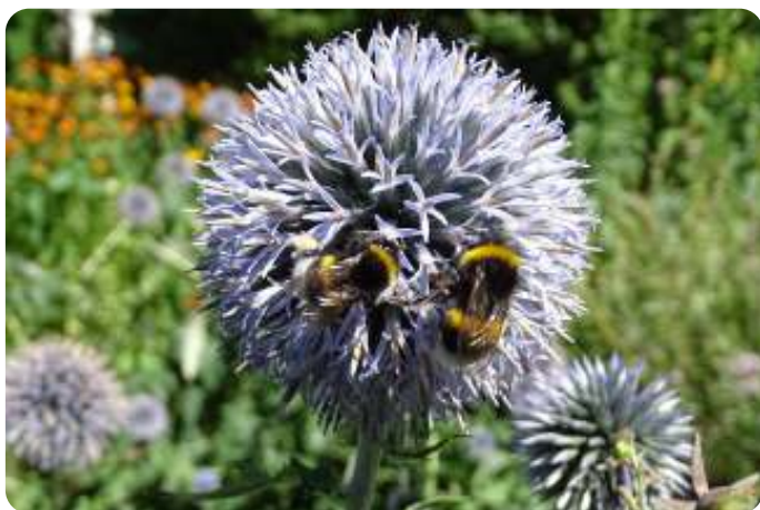
Kleine aardhommel

Alle mieren leven in grote groepen. Zo ook een aantal wespen (plooiwespen, hoornaars) en een aantal bijensoorten (honingbij en hommelseorten). Een belangrijk verschil tussen wespen en bijen is de voeding: wespen zijn rovers en eten dierlijk voedsel (prooi) en bijen zijn vegetariër en voeden zich met plantaardig materiaal (nectar en pollen)