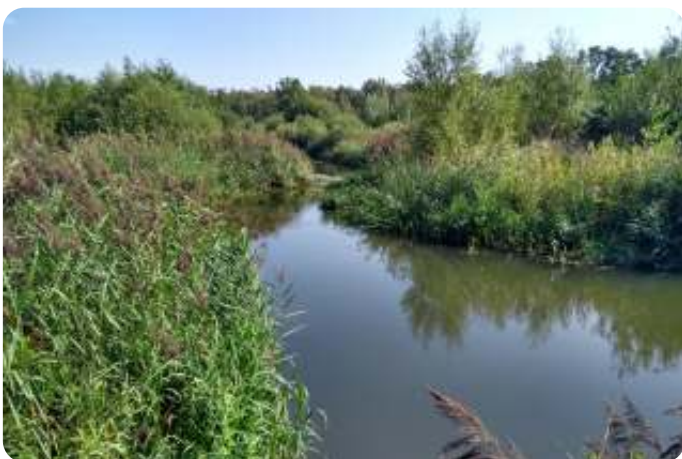
De Dommel bij de Hogt in de zomer

https://eindhoven.op-shop.nl/10584/bijeenkomst-voel-jij-nattigheid/02-03-2023