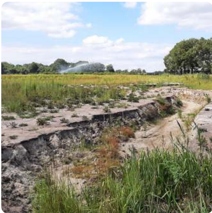
Volledig drooggevallen Kleine Beerze augustus 2022

Het waterschap is net als de gemeente een overheidsorgaan. Het algemeen bestuur is te vergelijken met de ge-