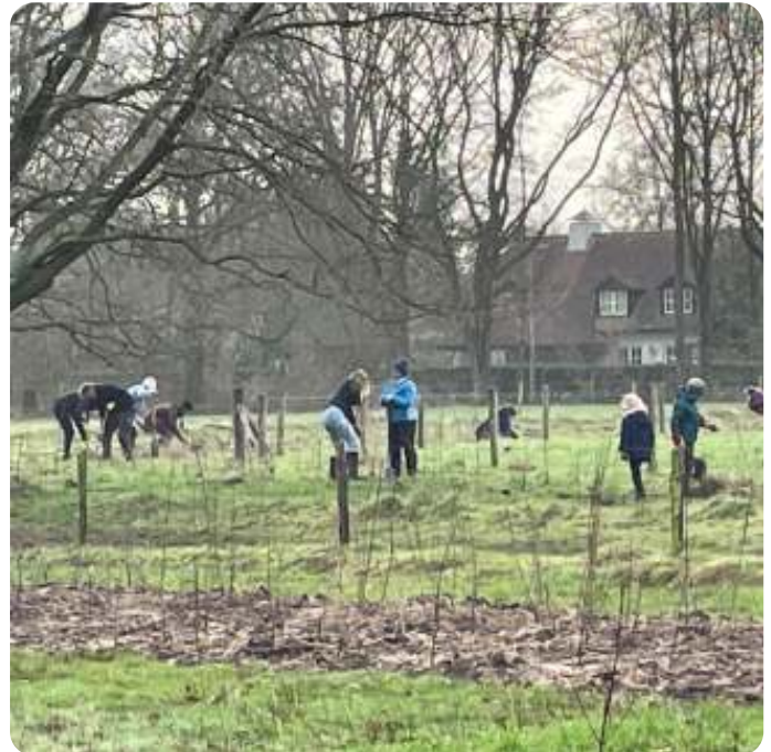
Bomen planten met IVN en Plan Boom

We kijken terug met een voldaan gevoel. We hebben een heel leerzame en gezellige ochtend gehad. Het smaakte naar meer dus er zijn al meteen plannen gemaakt voor de toekomst.