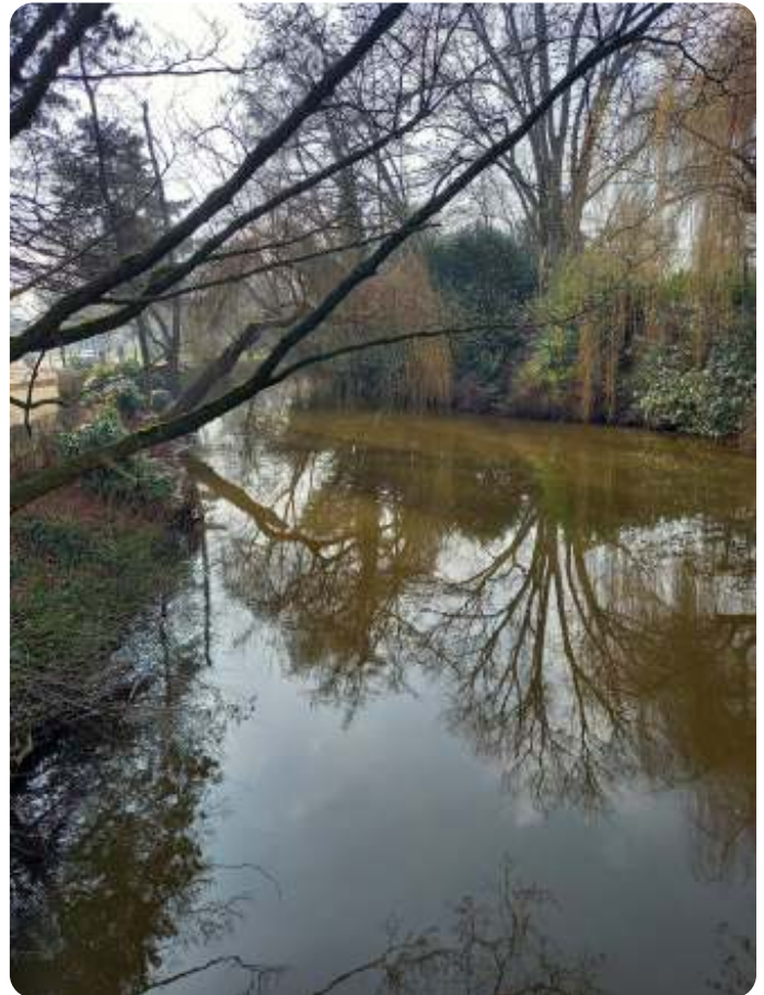
De Dommel

Op 2 maart is er een bijeenkomst bij de TU/e waarin de partijen hun standpunt toelichten en waarin de bezoekers inbreng kunnen hebben. De bijeenkomst is georganiseerd op initiatief van het Groencafé Eindhoven, uitgevoerd door het Waterschap De Dommel. Plaats: de blauwe zaal in het Auditorium op het TU/e-terrein. Ontvangst 19.30.