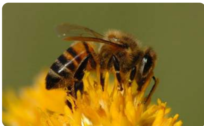
Werkster van de honingbij

Neem een half uurtje de tijd op een zonnig moment in je tuin of in een park op het weekend van 15 en 16 april. Download het telformulier en vul in wat je ziet. Het gaat om bijen, maar een aantal vliegen lijken daar sterk op en zijn ook van belang voor de bestuiving van onze bloemen. www.nationalebijentelling.nl