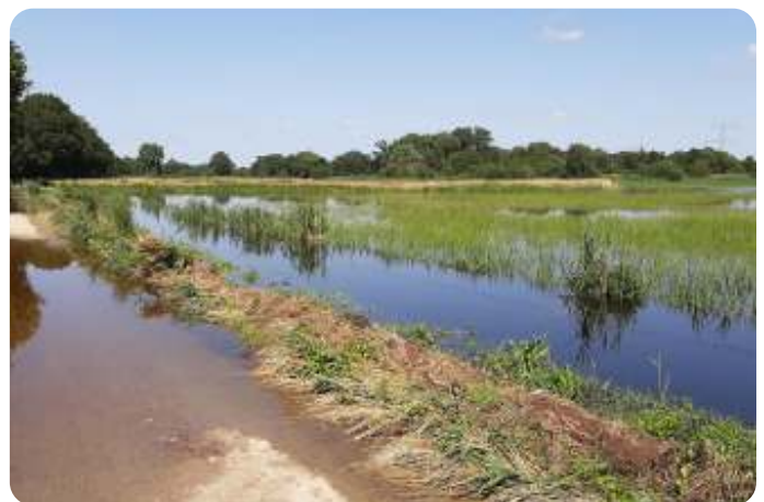
De Dommel is buiten haar oevers getreden in Juli 2021