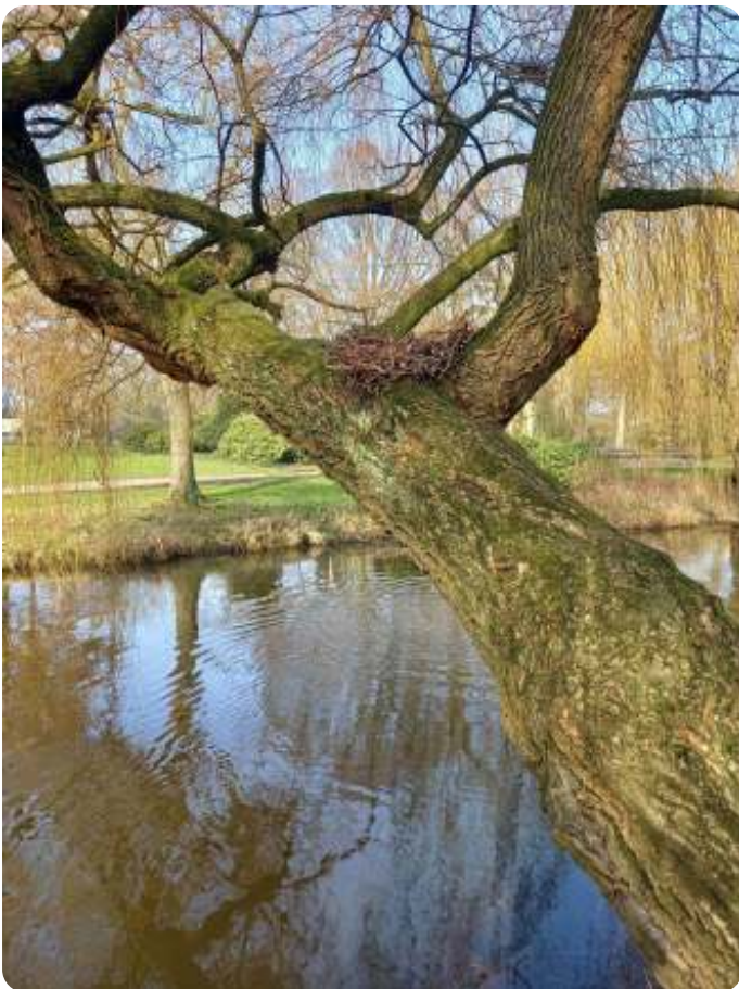
Deze waaghals boven de Dommel is gevlogen...

Vanuit het Groencafé met IVN hebben we met een groepje belangstellenden een stukje van dat 'lint' bekeken vanuit zijn ecologische kwaliteiten en kansen. Met een aantal medewerkers van de gemeente hebben we daarna een wandeling gemaakt en onze inzichten gedeeld. Dat stukje lint begint bij de Effenaar en lieten we eindigen bij de het