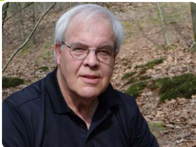
Pieter van Breugel

De rest van de angeldragers leeft solitair: dat wil zeggen dat elk vrouwtje zorgt voor haar eigen nakomelingen. Zij moeten dus ook allemaal bevrucht worden, wat maakt dat de verhouding vrouwtjes : mannetjes 1:1 is. Binnen een soort zijn mannetjes en vrouwtjes vaak te onderscheiden, omdat ze verschillend eruit zien. Dit speelt een rol bij de determinatie want binnen één soort kunnen de kenmerken dus verschillen.