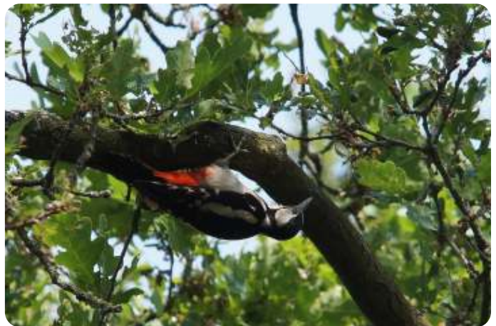
Vrouwje van de grote bonte specht

ruiter. Loop vanaf het kijkpunt terug naar de bosrand en ga rechts.