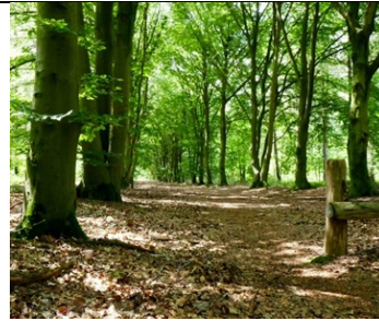
Beukenlaan in de zomer

Een merkwaardige laan: prachtige beuken in een Brabants naaldbos. De grootte van de bomen geeft aan, dat ze er al stonden voordat de omliggende naaldbossen werden aangeplant. Waarom er beukenlanen zijn aangelegd in een gebied dat vooral uit heide bestond, is niet bekend. De beuk werd aan weerszijden van oprijlanen geplant. Veel schaduw in de zomer, prachtige bladverkleuring in de herfst. Een droog en stevig wegdek door zijn wortelstelsel, dat gedeeltelijk boven de grond groeit. De boom stelt wel voorwaarden aan de bodem. Die moet leemachtig, vrij voedselrijk en niet te nat zijn. In de Molenvelden is dit het geval.