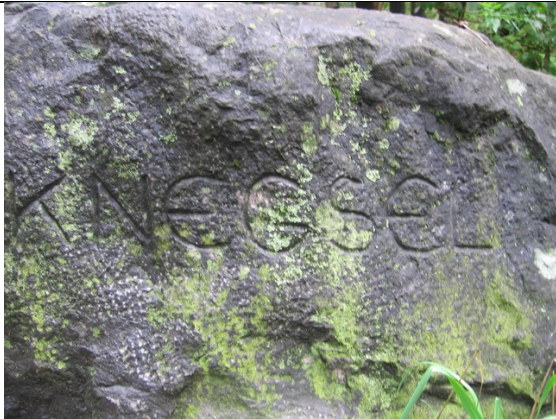
Tekst op de steen