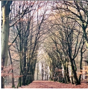
Beukenlaan in de winter