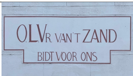
OLV van 't Zand