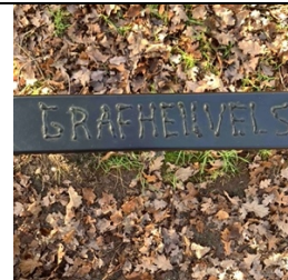
Tekst bij de grafheuvels

Op Veldhovens grondgebied liggen veel grafheuvels. Deze zijn opgeworpen tussen 2000 tot 900 jaar voor Christus. De heuvels zijn nog te zien, omdat ze na een gedegen onderzoek werden gerestaureerd. Uit bodemverkleuring is bekend dat er grafheuvels omringd zijn door één palenkrans of een dubbele palenkrans. Er zijn er ook met een greppelrand. Er ligt zelfs een combinatie, bestaande uit een hoofdheuvel met een bijheuvel. Al deze heuvels zijn onderzocht. Bij een dergelijk onderzoek wordt voorzichtig te werk gegaan, want niet alleen de voorwerpen die gevonden worden, kunnen iets over het verleden vertellen, maar ook uit de verkleuringen van het zand kan veel worden afgeleid. Het is als het lezen van een boek, echter wel een boek dat slechts één keer is door te bladeren. Er zijn o.a. urnen met verbrande botresten gevonden. Daaruit kan het geslacht en ongeveer de leeftijd van de overledene worden geschat en er zijn zelfs methoden om het tijdstip van overlijden te bepalen.