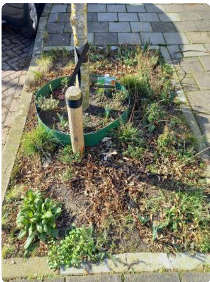
Adopteer een straat

Er zijn ook bewoners die de boomspiegel of geveltuin zelf beplanten. Hierbij tips welke planten zich lenen voor het beplanten van een boomspiegel. Natuurlijk geldt dit ook voor de eigen tuin.