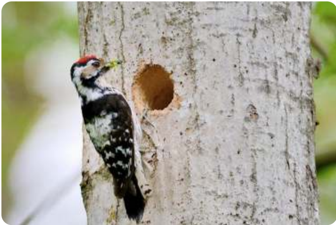
Mannetje van de kleine bonte specht