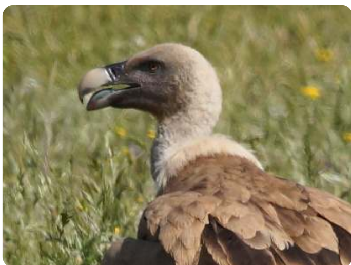
Vale gier

De dagen hebben een, min of meer, vaste indeling. De wekker gaat om 7 uur, maar meestal zijn we al wakker door het vrolijke gekwetter van zwarte spreeuwen, huismussen, zwarte roodstaart of zelfs een orpheusspotvogel. Enkelen zor-