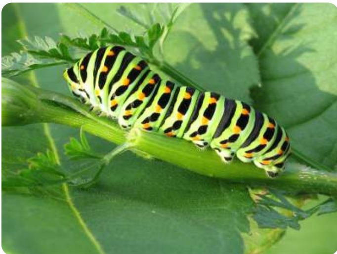
Rups van de koninginnenpage