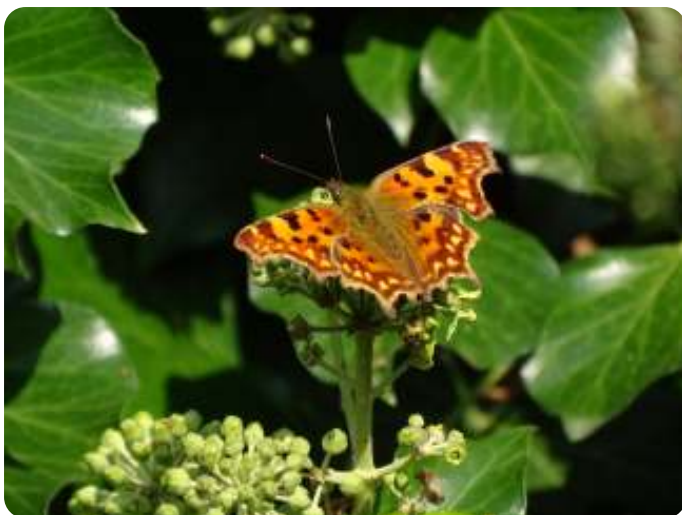
Klimop