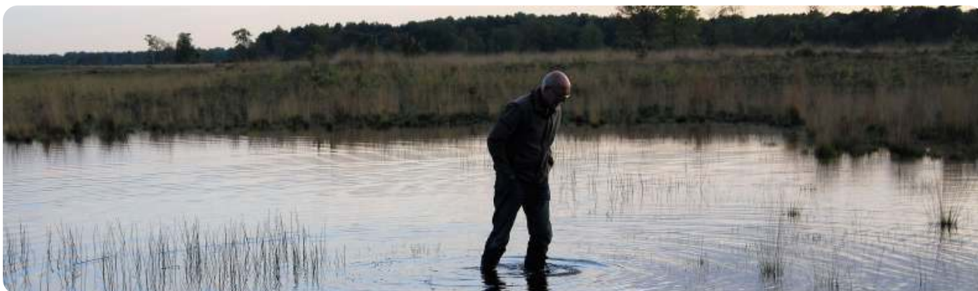
Dré op pad met de waterwerkgroep