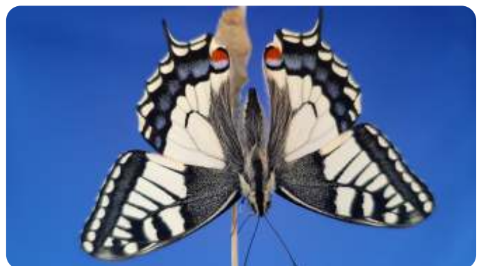
Koninginnenpage uitgekleurd