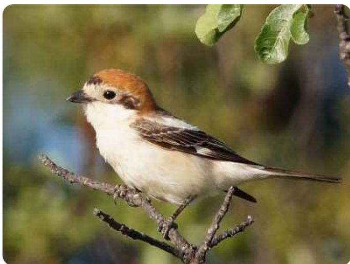
Roodkopklauwier