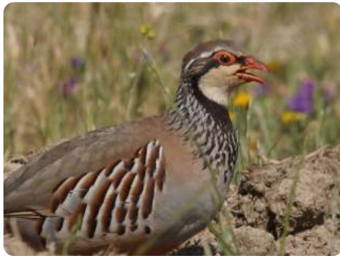
Rode patrijs