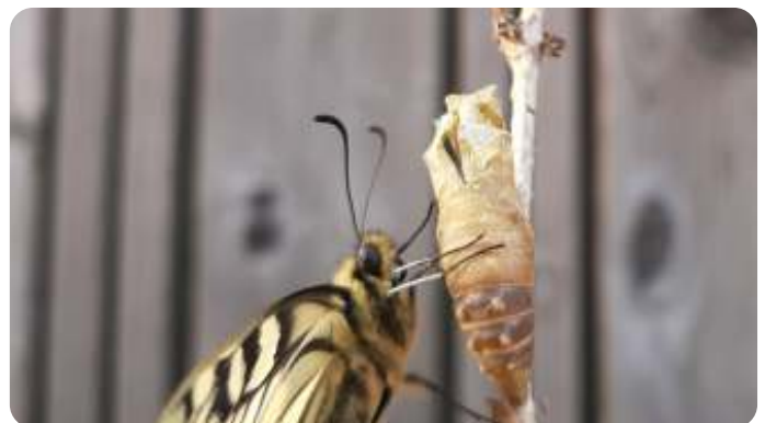
Juist verpopte koninginnenpage