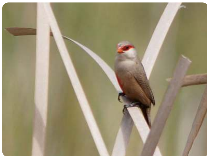
Sint Helenafazantje

Op 6 mei vertrok een drietal vogelaars per auto, met overnachtingen in de buurt van Bourges en Biarritz. De andere negen volgden op 8 mei met het vliegtuig vanuit Eindhoven naar Sevilla. We arriveerden vrijwel gelijktijdig op onze bestemming in Santa Cruz de la Sierra, even ten zuiden van Trujillo. Het hoofdverblijf was een rustieke “casa” uit 1563 aan het centrale dorpsplein, waar de 9 mannen sliepen en de hele groep ontbeet op de binnenplaats onder de citrusbomen. De 3 vrouwen hadden hun eigen appartement, 100 meter verderop. Ondanks de bekendheid als paradijs voor vogelaars staat het toerisme ter plaatse niet hoog op de agenda; voor communicatie met de lokale bevolking was de app “Google Translate” onmisbaar, Engels wordt er niet begrepen en onze kennis van het Spaans was beperkt. De hele week ook maar 1 auto met een buitenlands (Nederlands) kenteken gezien.