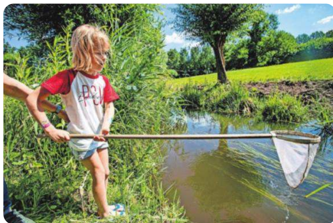
Vlak bij de sloot hengelen naar beestjes. Wel vastgehouden aan je shirt — voor je het weet lig je erin...

Naast de rondwandeling door 't Heempark, het knutselen van een waterlelie en het tekenen van je waterbeestje (dat er bij sommigen meer uitzag als een watermonstertje), kon er bij de verhalenboom geluisterd worden naar een verhaal van Toon Tellegen met, hoe kan het ook anders, in de hoofdrol een waterbeestje: Het schrijvertje en de eekhoorn.