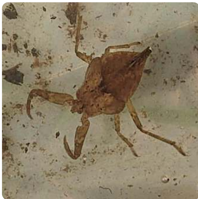
Nimf van een waterschorpioen

Jack: „Ik werk als expat voor ASML en in het weekend vinden we het leuk om erop uit te gaan. We wonen hier nu een jaar en zijn onder de indruk van de natuur die gewoon midden in de stad ligt. Activiteiten zoals deze zijn perfect voor onze jonge kinderen en wij genieten van het buiten