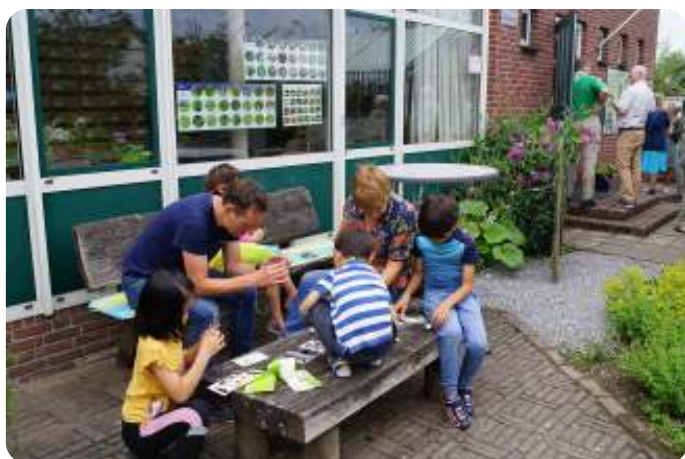
Voor kinderen is er veel te doen: knutselen en speuren door de hele tuin