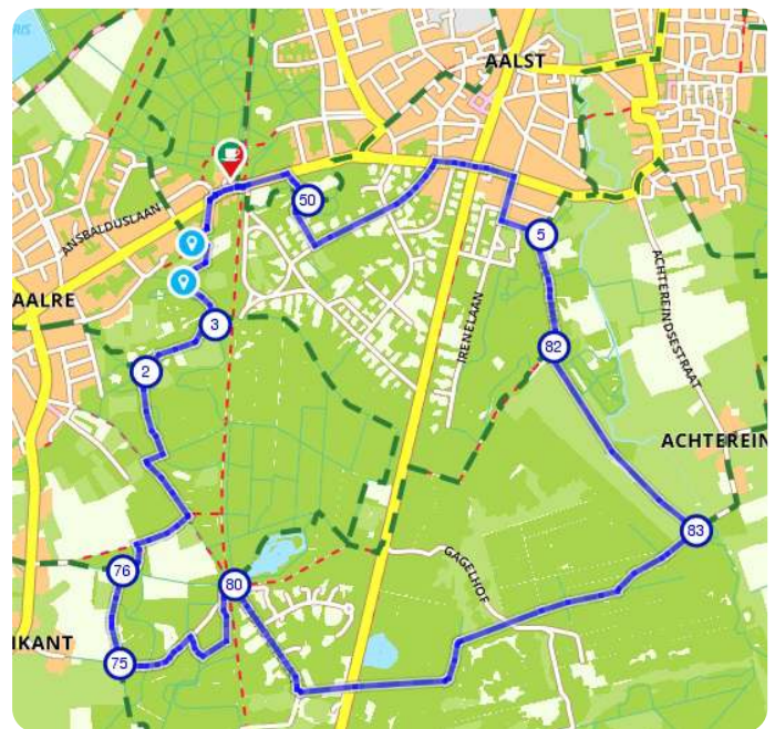
De wandelroute start bij de hut van Mie Pils

Het gaat niet alleen om potentie, zou kunnen of mogelijkheden, het gaat om handelen, dus echt een offensieve natuurstrategie.