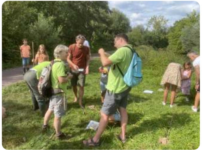
Impressie van de slootjesdag

We kijken terug op een leuke middag aan het water. Wie weet levert het nog wat leden op!!!