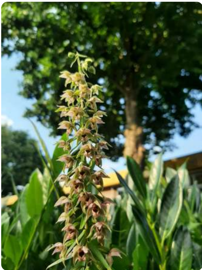
Brede wespenorchis

Zou de wespenorchis echt samenleven met een schimmel verwant aan de truffelzwam?