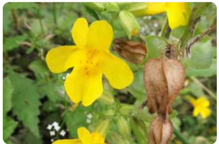
Gele maskerbloem