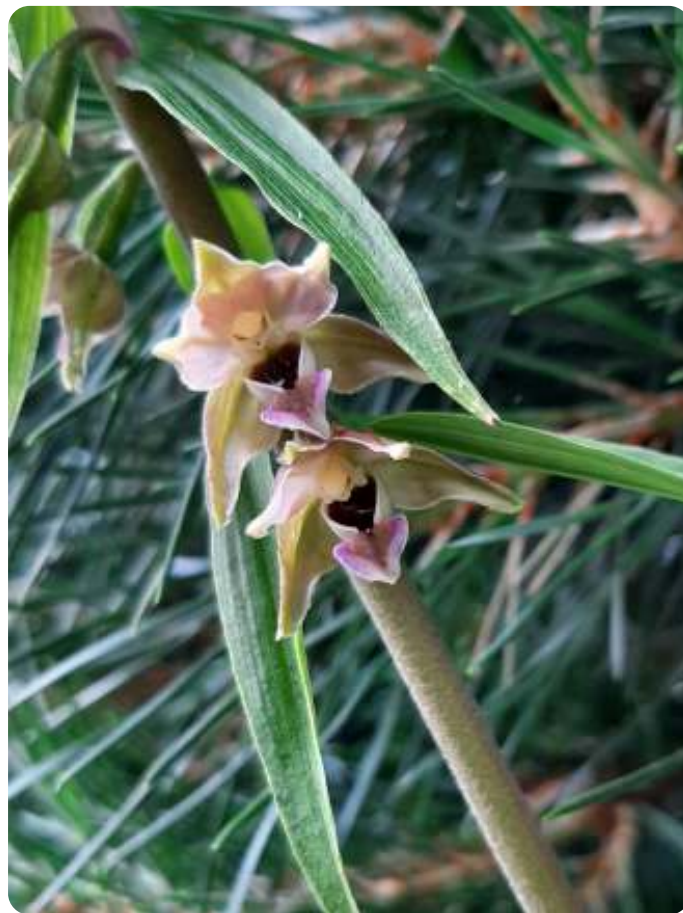
Close up van de brede wespenorchis