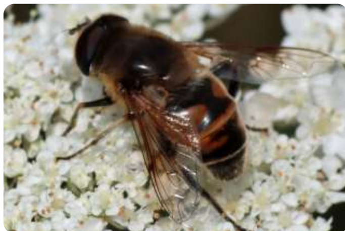
Blinde bij