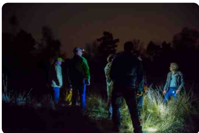
Excursie Waterdieren horen, 14 april