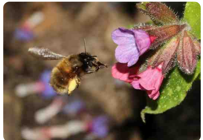
vrouwtje gewone sachembij