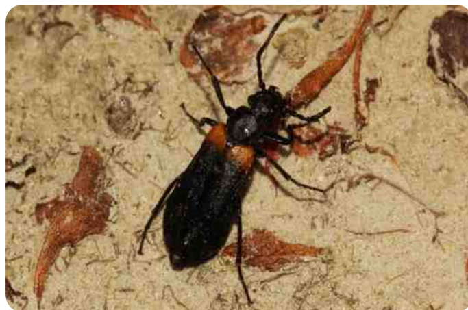
Sitaris muralis volwassen dier (15 mm lang)