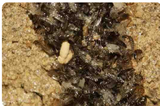
larven Sitaris muralis nog geen 2 mm groot

Weer een jaar later kwamen er in augustus parasitaire kevers met de naam Sitaris muralis uit mijn leemwandje. Deze kevers kunnen niet vliegen en leggen eitjes aan het eind van de zomer voor de nestgangen van de sachembijen. De daaruit komende larfjes overwinteren. Als in het voorjaar mannelijke bijen tevoorschijn komen, klimmen de keverlarven op zo'n man en liften mee om tijdens de paring naar het vrouwtje over te rennen, dat deze parasieten ongemerkt zelf meeneemt, haar nest in. Wonderen der natuur in eigen tuin.