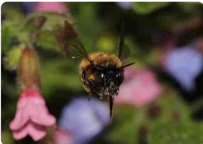
vrouwtje gewone sachembij

Gewone sachembijen zijn er al vroeg in het voorjaar, als het longkruid bloeit of de winterheide. De eerste mannen zijn er soms al in maart en verkennen de omgeving. Hierbij nemen ze steeds dezelfde vliegroutes langs bloeiende planten en soms zetten ze er ook geurtjes op af om de kans te vergroten dat er paringslustige vrouwtjes langs komen. Die vrouwtjes maken hun broedcellen bij voorkeur in leemachtige bodem en dan nog het liefst in steile wandjes. Vroeger gebeurde dat ook massaal in oude muren met zachte kalkspecie in hun voegen.