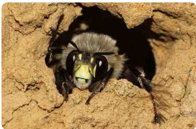
mannelijke Sachembij in leemwand

Zelf heb ik een leemwand van 50 cm hoog en 60 cm diep gemaakt die door gewone sachembijen al direct in het eerste jaar in gebruik werd genomen. Het vrouwtje graaft de broedcel uit en belikt van binnen de wand met speeksel waardoor die zo hard wordt als beton. Een badkuipje nectar met stuifmeel dient als voedsel voor de larve, die pas een jaar later als nieuwe bij verschijnt. De ouders zijn dan al lang dood.