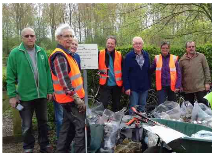
Het paasbestteam paasbest gekleed bij hun verzameling.