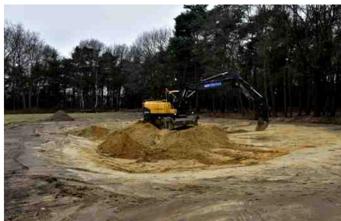
Graven op eenzame hoogte of de kleintjes bij elkaar schrapen?