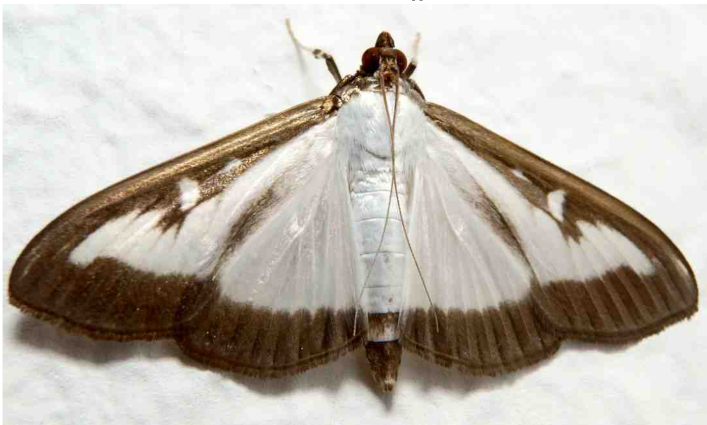
Buxusmot Cydalima perspectalis . Afb. Wikipedia