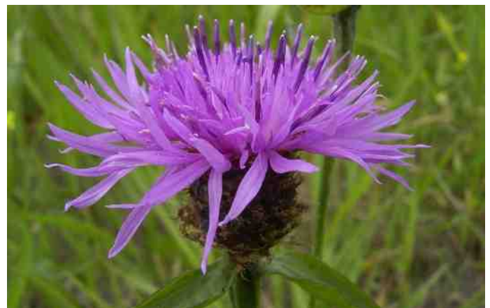
Knoopkruid, duidelijk verwantschap met korenbloem, ook een composiet