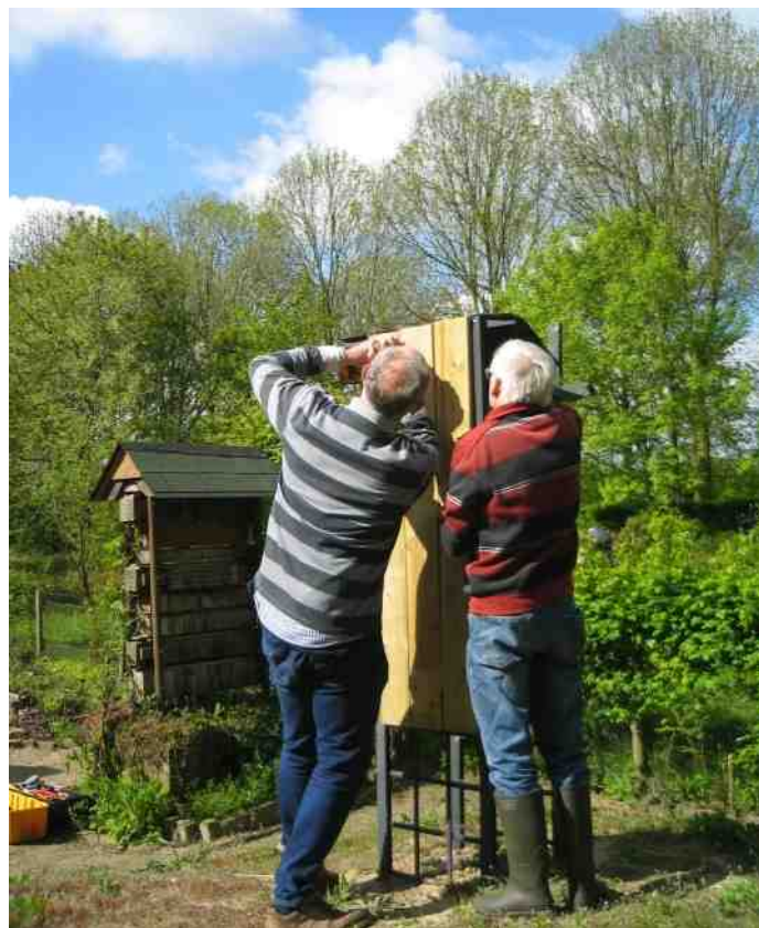
Nog even schroeven en beplaten en er kan geen bij meer bij, of toch...