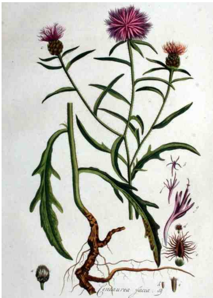
Knoopkruid uit de Flora Batava van Jan Kops.