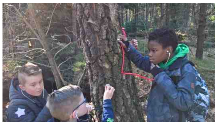
Aandachtige bomendokters beluisteren gespannen de sapstroom.