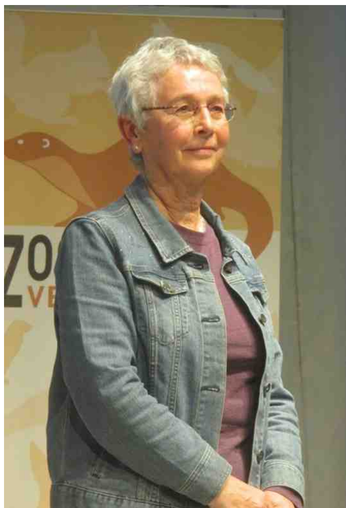
Dat was een verrassing. Stilgehouden. Meegetroond.