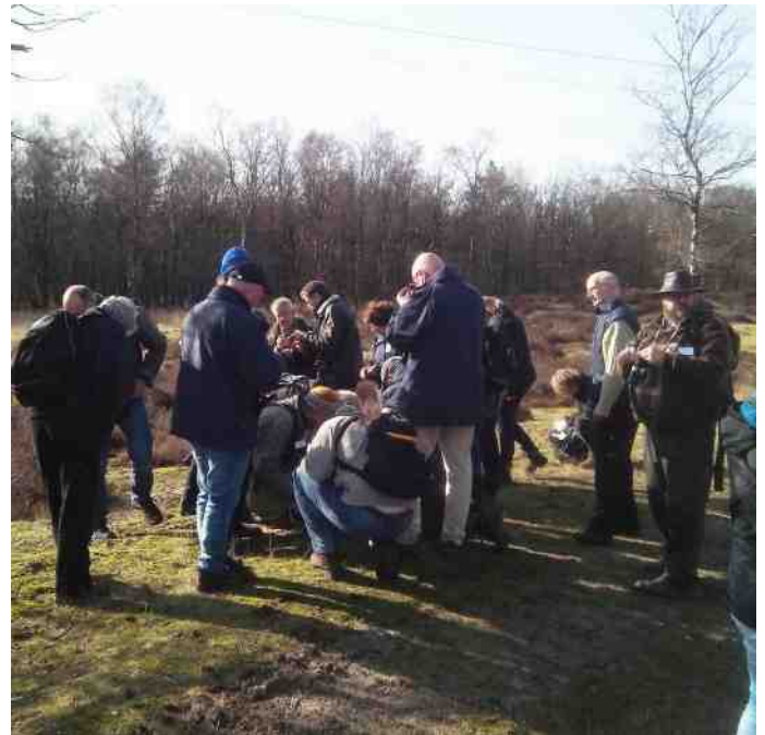
Mossen zoeken en bekijken, de wondere wereld van het kleine.