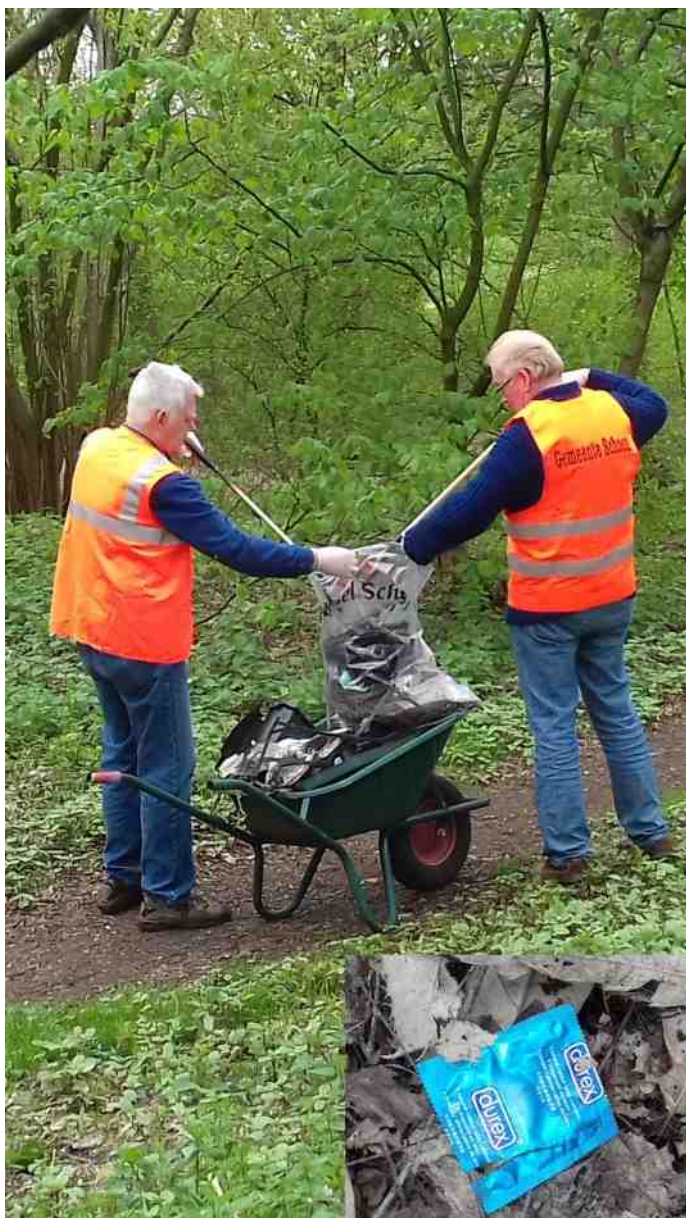
Als je iets doet, doe het veilig in passende kleding.