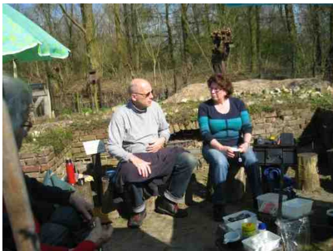
Fer en Jeanine praten even bij. Minstens zo belangrijk als wroeten.

Otte mee naar huis genomen. Voor de veiligheid, natuurlijk, over een poosje zullen ze hier weer hangen.