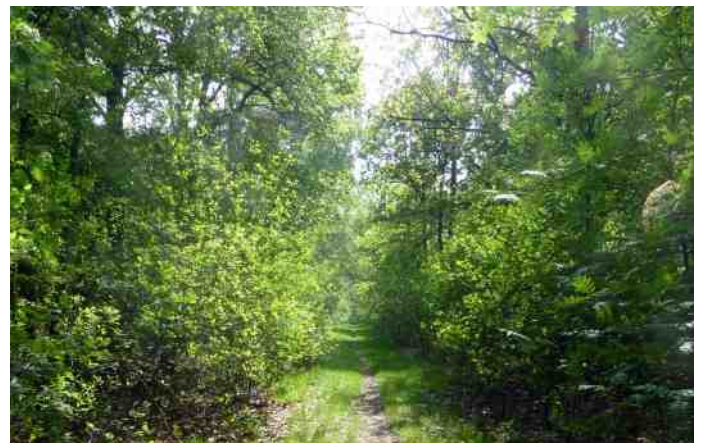
Het Lijnt en het Gereg, een aaneengesloten bosgebied.