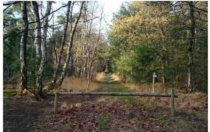
Een laan door 't Hurkske. Langzaam wordt het bos gevarieerder.