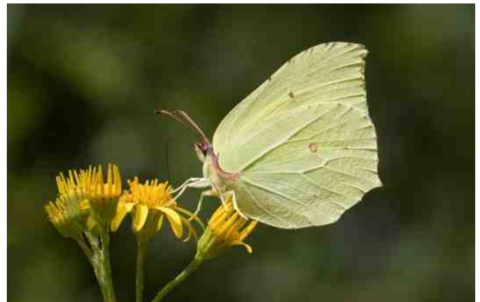
Nectarzuigende Citroenvlinder.