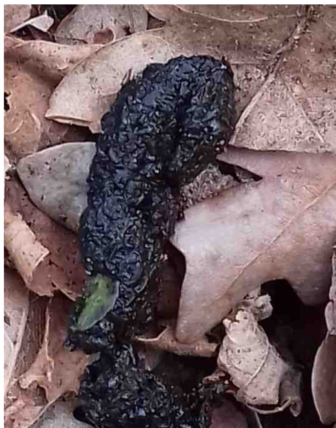
Nee, die nemen we niet mee, da's natuur met pitjes.