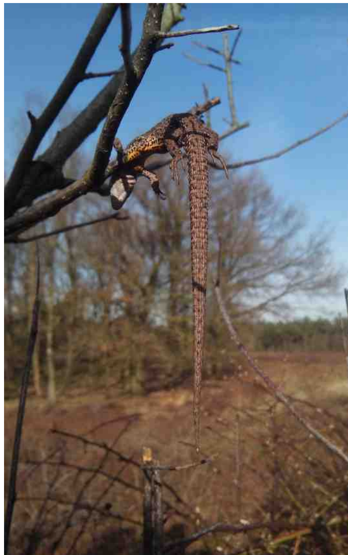
Aan alles komt een einde, hier was de klapekster behulpzaam.

Foto's en tekeningen zijn ook héél welkom.