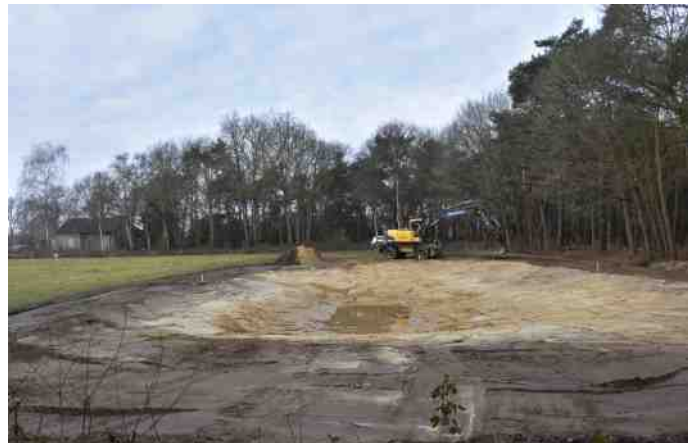
Laat nou regenwater en grondwater de poel maar vullen.