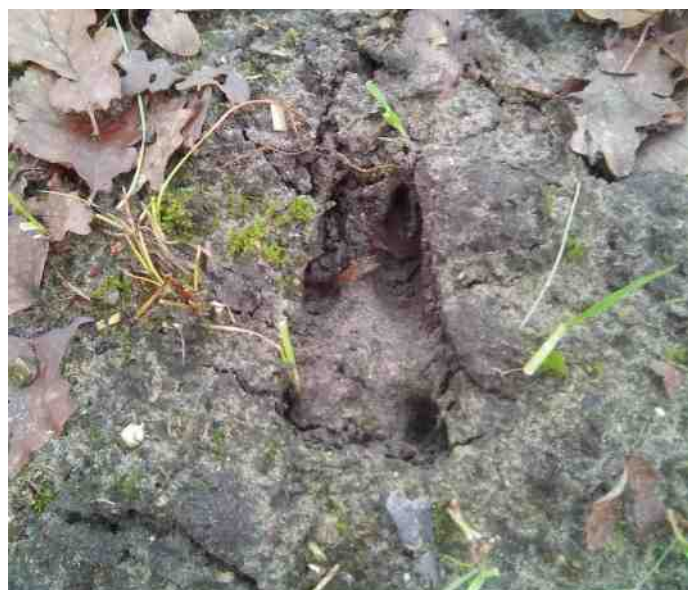
Een mooi duidelijk spoor van een ree in de zachte vochtige grond.

De wandeling duurt twee uur en start om 10.00 uur op de parkeerplaats Middengaal, naast voormalig Pieter Brueghel centrum.