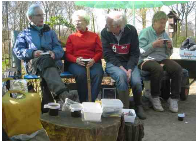
Daar zitten ze weer te niksken, altijd die koffie, d'r kumt gin end an.

Tot ziens in het Geerbos en groetjes van Lidou.