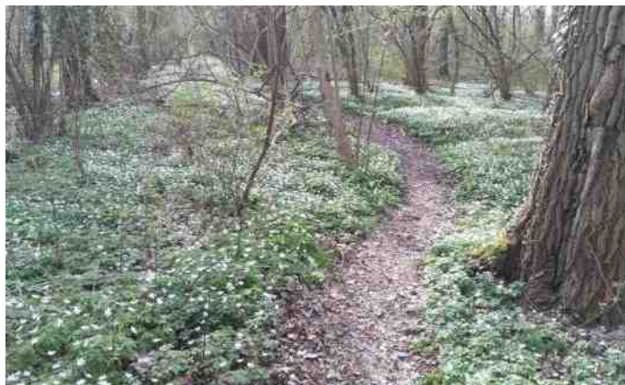
Een lentebeeld, bosanemonentapijt in het Wijboschbroek.