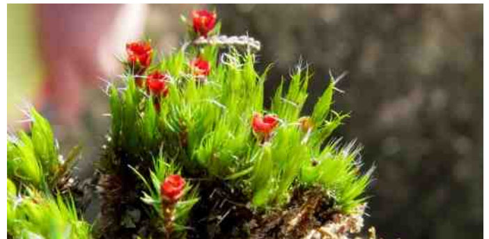
Ruig haarmos en Grijs kronkelsteeltje.