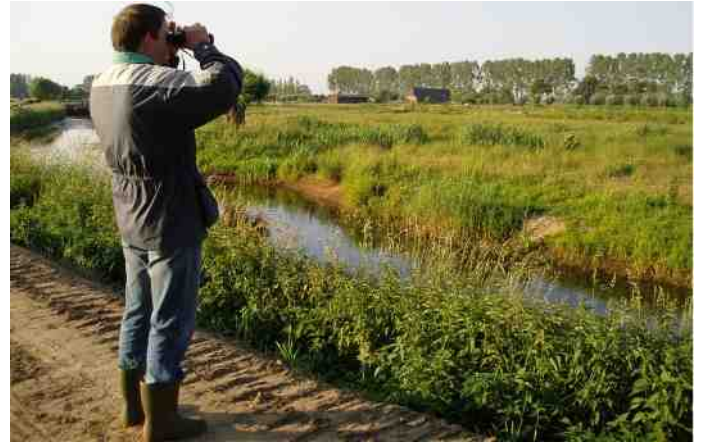
Turen naar blauwborsten in Ham Havelvlt.

't Hurkske is in de jaren dertig bebost om stuthout voor de mijnen in Limburg te leveren. Vroeger werden bossen veelal gezien als houtakkers. Nu wordt meer de waarde van natuur ingezien en mogen oude bomen blijven staan. Er zijn veel poelen aangelegd om amfibieën en met name de knoflookpad meer kansen te geven. Goede startpunten voor