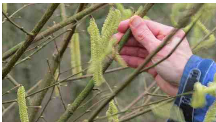
Ben je er vroeg bij dan is de wind je bestuivingshulp.