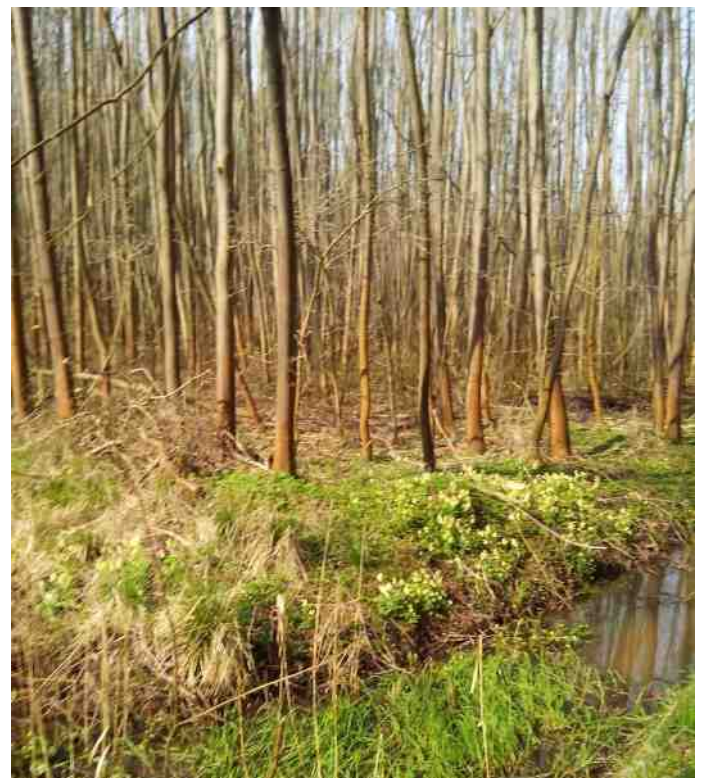
Essenbos met sleutelbloem in Wijboschbroek.