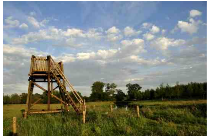
Dommeldal met uitzichtpunt op meanderende beek.