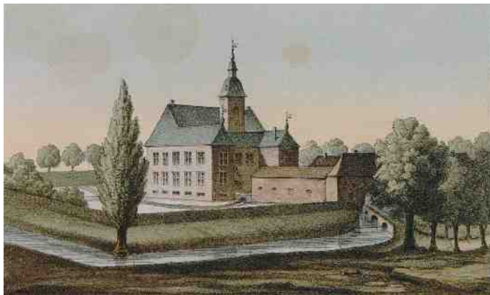
Kasteel Bleijenbeek in 1860.