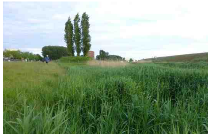
De Wachters op de Schil en de Punt ingeklemd tussen A50 en industrie.