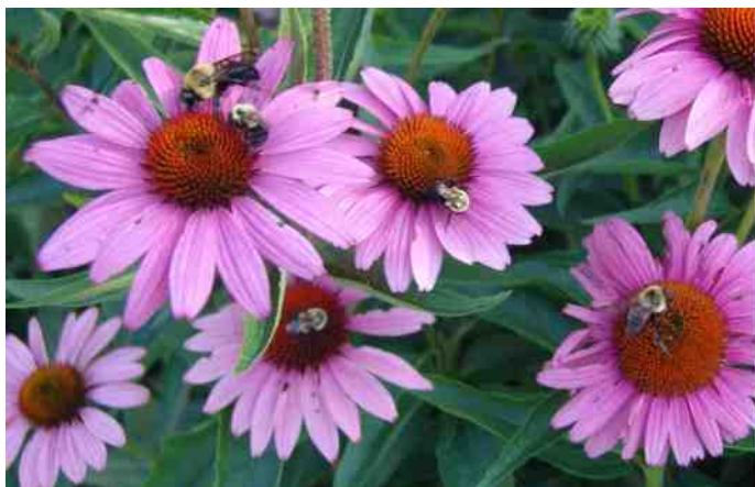
Zonnehoed de exotische aanwinsten van Lidou. Dr. Vogel is er dol op.

Papa was hier lang geleden geweest, hij herkende de insectentuin niet meer, tja er is veel veranderd sinds 30 jaar!