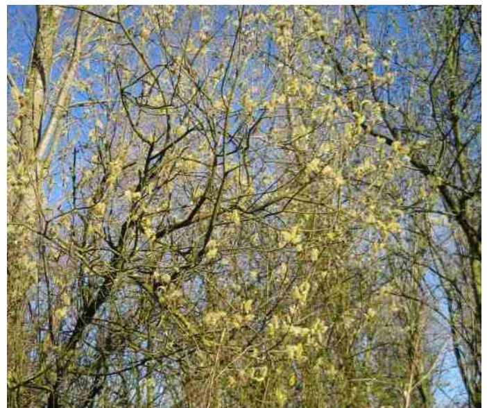
Wilgenkatjes, het beeld van een vroege lente.