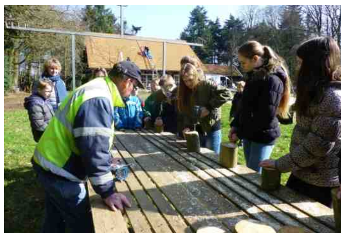
Bijengaatjes boren maakt bijenhotelblokjes.