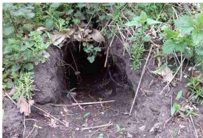
Wie woont hier? Spoorzoekers met een goede neus?