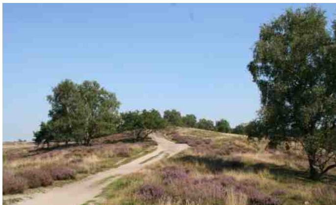
Een blik op het landschap van de Maasduinen.