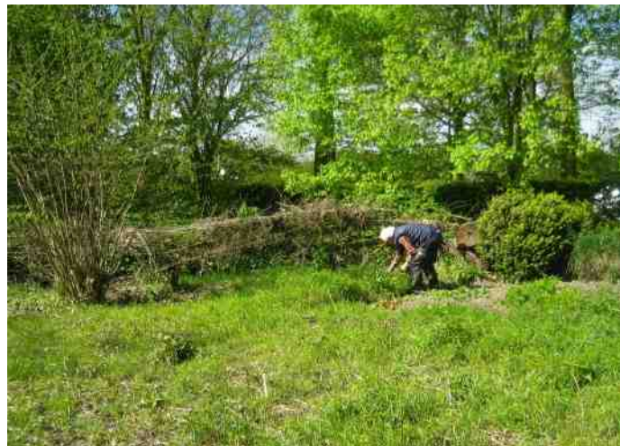
Brandnetels plenty... én die minuskule reuzenbalsemien. Een oerwoud...