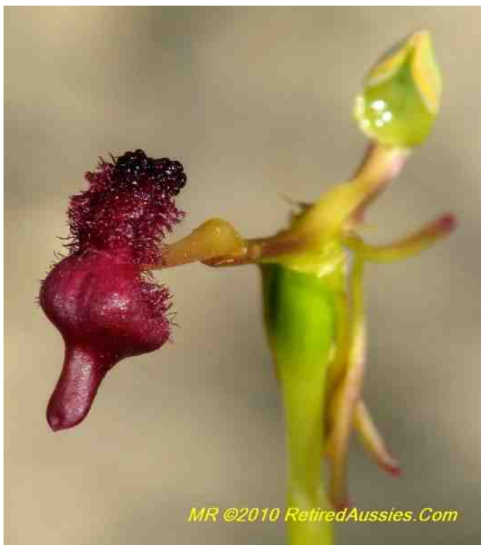
De hamerorchidee Drakaea concolor .

gewoon te weinig talrijk in elkaars buurt aanwezig, de kans dat een wespenmannetje al een echt vrouwtje gevonden had voordat hij iets aan de bestuiving kon doen, was gewoon te groot. En dus hebben de Australische natuurbeschermers ingegrepen om het definitief van de aardbodem verdwijnen van Caladenia concolor te voorkomen. Ze pakken gewoon een penseeltje, nemen daarmee de stuifmeelklompjes uit de ene bloem en brengen ze naar een andere. Bij de veeteelt noemen we dat KI, en bij de kweek van sierorchideeën is het ook een heel algemene techniek. Het blijkt goed te werken, met weinig moeite worden de tekort schietende wespjes verholpen.