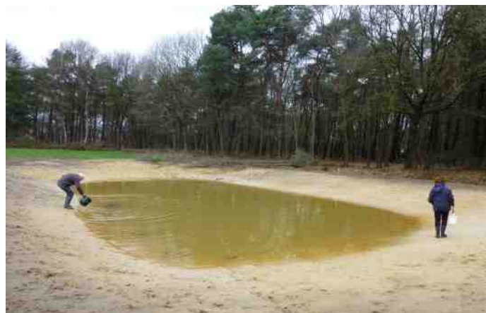
De finishing touch, Matty ent het water met water uit een nabije poel.