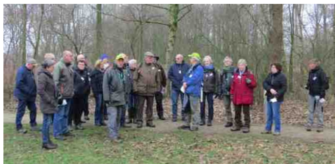
Bijna voltallige wintercursusgroep tijdens de 1e excursie.

Namens het bestuur, Fer Kalis, voorzitter