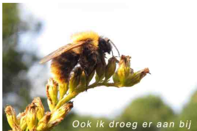
Ook ik droeg er aan bij