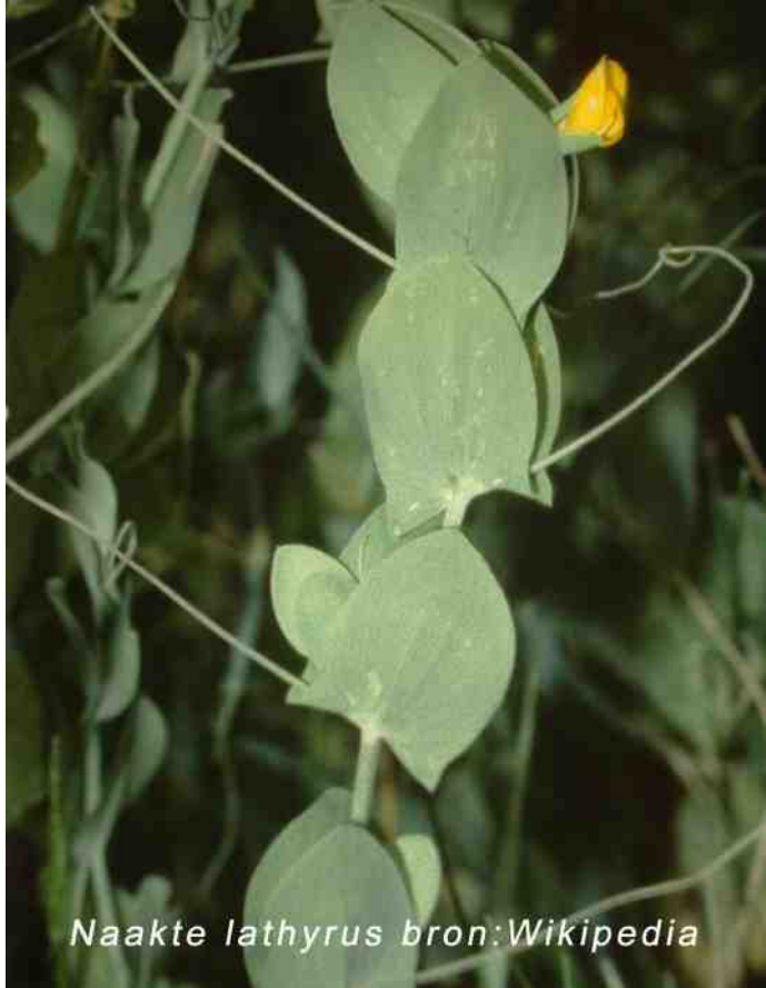
Naakte lathyrus