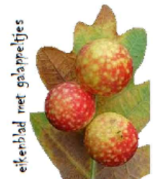
eikenblad met gaappretjes