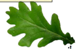
blad van zomereik