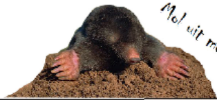
Mol uit molschoep

Ga linksaf de Schaapsdijk op: Houd de sloot aan je linkerkant en ga dan het eerste kleine paadje voor de andere sloot naar rechts. Op deze plek heeft heel lang geleden een galg gestaan. In het bosje rechts bevinden zich grafheuvels, uit de ijzertijd! Het paadje kronkelt langs de bosrand; eerste pad links inlopen, helemaal doorlopen tot het eind.