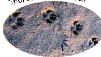
Sporen van een vos

Vroeger stond de galg meestal aan een doorgaande weg, op de grens van het dorp. De bezoekende vreemdeling werd daarmee gewaarschuwd: Denk erom! Als je je in ons dorp misdraagt, loop je kans om hier opgehangen te worden!!