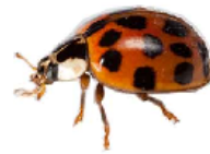
veelkleurig Aziatisch lieveheersbeestje Heeft een deukje bij zijn kontje!

Ga door de slagboom. Ga na 100 meter het paadje naar links. Zoek op de hoek een boom met ingegroeid prikkeldraad. Hoe hoog zit het prikkeldraad over 10 jaar? a 10 meter hoger: loop rechtdoor b even hoog: ga links