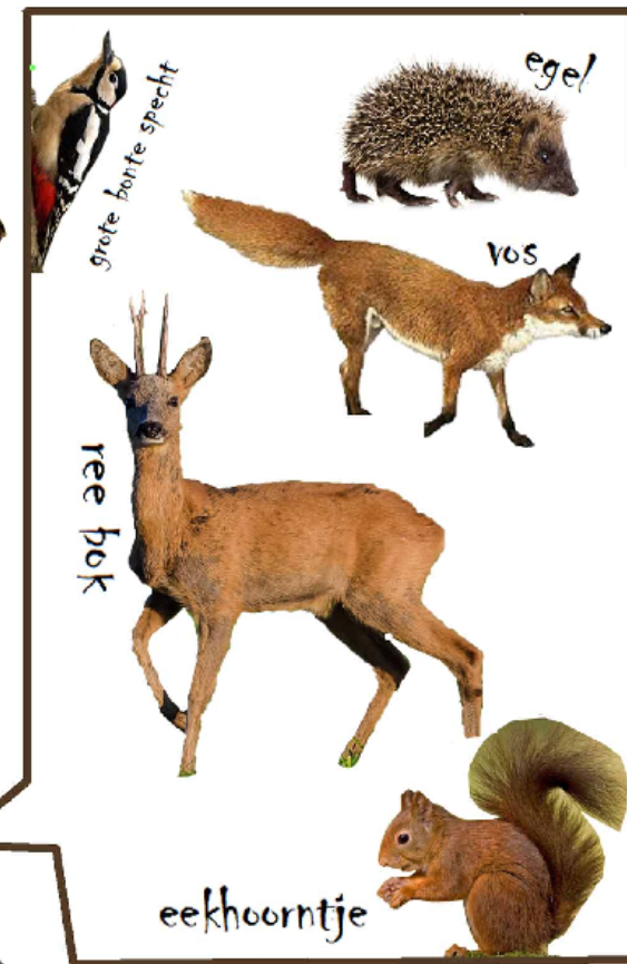
grote bonte specht