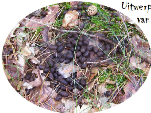
Uitwerpselen van een ree

Loop terug tot de splitsing en ga hier linksaf, steek de verharde weg over en volg het zandpad terug naar het beginpunt! Langs het zandpad: LUISTER!! Wat roepen de vogels? Worden we uitgelachen? Moedigen ze ons aan? Of is het angstvallig stil?