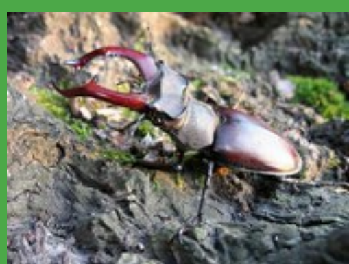
Groot Vliegend Hert (m)