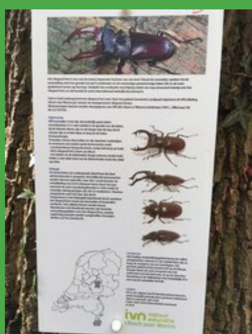
Info-plaat voor toeristen en dagjesmensen