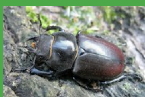
Groot Vliegend Hert (v)