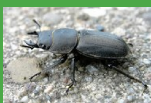
Klein vliegend hert