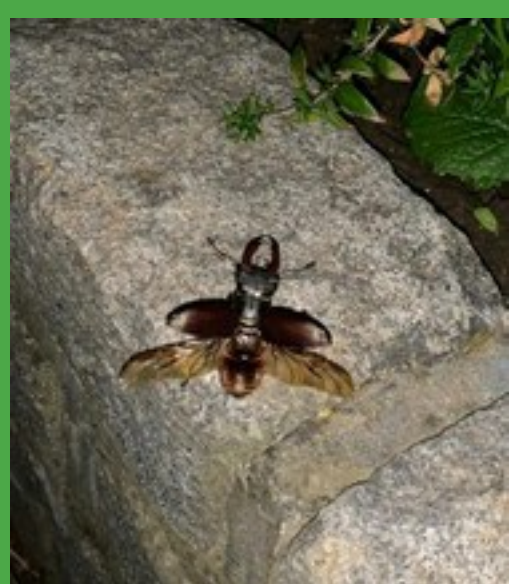
Mannetje GVH net voor het wegvliegen