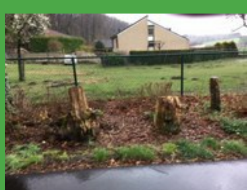
Uitbreiding bestaande broedsatoot Warderweg 2021