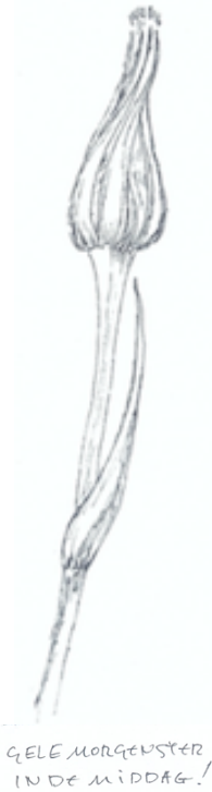
GELE MORGENSTER IN DE MIDDAG!

Sommige eenjarige onkruiden bloeien het hele jaar door, zoals vogelmuur, paarse dovenetel, herderstasje en gewone melkdistel. Ook nu in januari waren ze te zien. En wist u hoeveel voeten een gans wel heeft? In elk geval drie: melganzevoet, rode ganzevoet en spiesganzevoet.