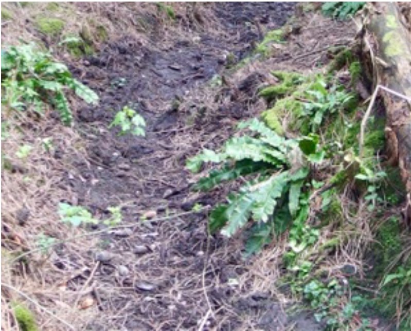
Tongvarens in het Kralingse Bos, 27 september 2019.