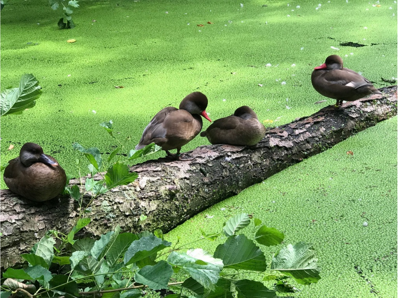
Rustende Krooneenden.

Heeft u een leuke of bijzondere waarneming op foto vastgelegd en wilt u die op deze plaats aan anderen laten zien? Stuur uw foto in, liefst met een kort bijschrift, en wellicht wordt hij geplaatst in de volgende Nieuwsbrief.