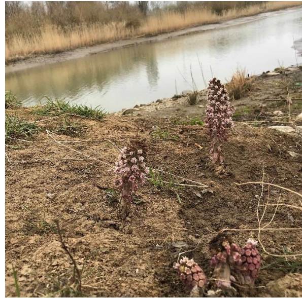
Langs het pad bloeit het Klein –en groot hoefblad.

Aan eind van het pad slaan we linksaf en komen bij een vogelkijscherm, wat een prachtig uitzicht biedt op de slikken. Op een T-splitsing slaan we rechtsaf en lopen langs de Afval Water Zuiverings Installaties (AWZ). De uitstroomgeul van deze installaties splitst het gebied in tweeën.