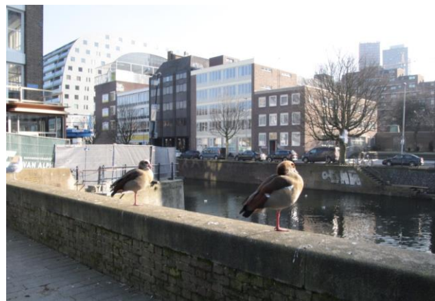
Een koppeltje Nijlganzen op een kademuur langs Het Hang © Frank Biesta.