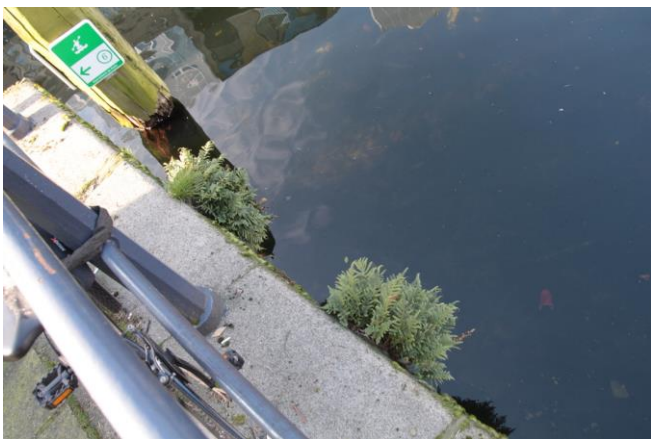
Eikvoarens op een kademuur, hoek Lombardkade en Delftse Vaart © Frank Biesta.

Heb jij soorten, planten of dieren, recentelijk waargenomen in stedelijk Rotterdam, meld ze dan bij ons: liesbethdenhaan@gmail.com , liefst met (scherpe) foto waarop de locatie duidelijk te zien is. Het kan gaan om een plant, een dier, een al dan niet bebroed nest, een kolonie mussen, prooiresten, een hol, enzovoort. Wellicht kunnen we de door jou gesignaleerde locaties opnemen in een stadssafari-route.