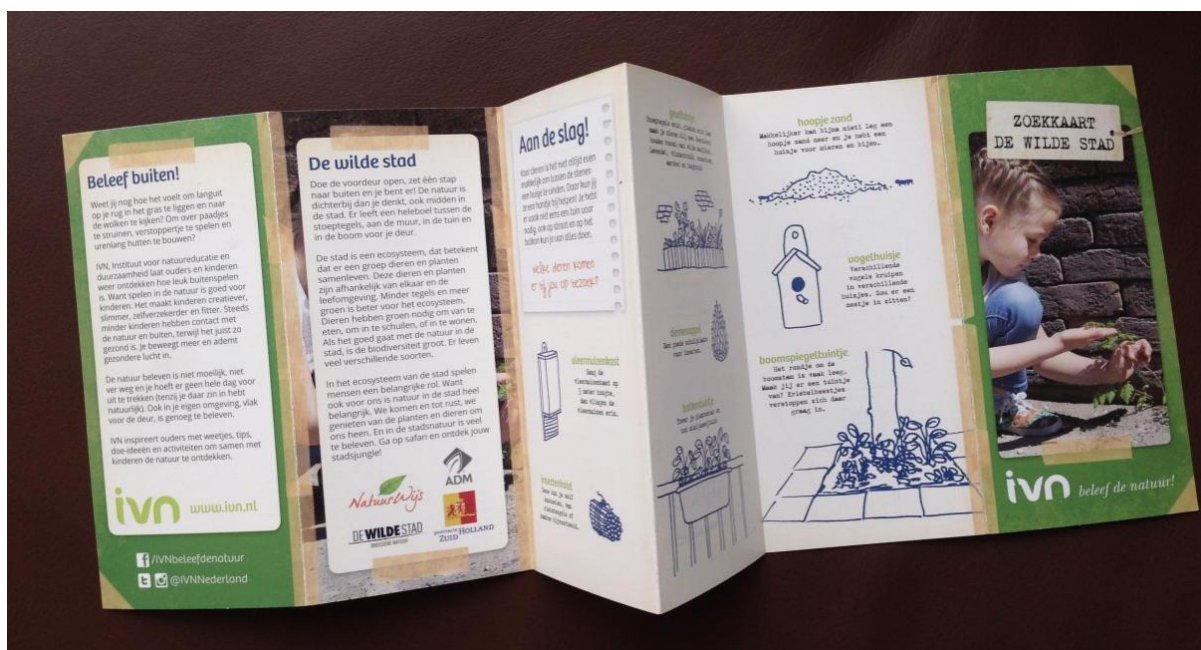
De nieuwe zoekkaart De Wilde Stad.

Tijdens de bijeenkomst werd ook de zoekkaart 'De Wilde Stad' onthuld. Vrijwilligers uit Den Haag, Leiden en Delft hebben aan de totstandkoming meegewerkt. De zoekkaart is bij het provinciale kantoor van IVN in Den Haag te bestellen. Er wordt nog gewerkt aan een boek dat de titel krijgt De Wilde Stad - Stadsjungleboek , vol informatie en tips voor actieve beleving van de stadsnatuur. In grote lijnen zijn alle hoofdstukken rond, en alle pagina's lagen uitgespreid ter inzage. De deelnemers aan de bijeenkomst konden erop aangeven wat zij voor commentaar, tips en ideeën hadden om de inhoud te verbeteren of te completeren. Het boek zal waarschijnlijk in juli verschijnen. Prijs en bestelwijze zijn nog niet bekend (eind mei 2017).