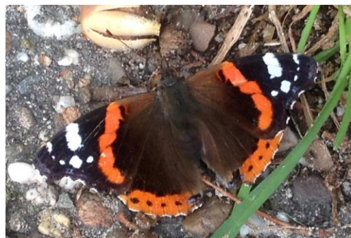
Atalanta