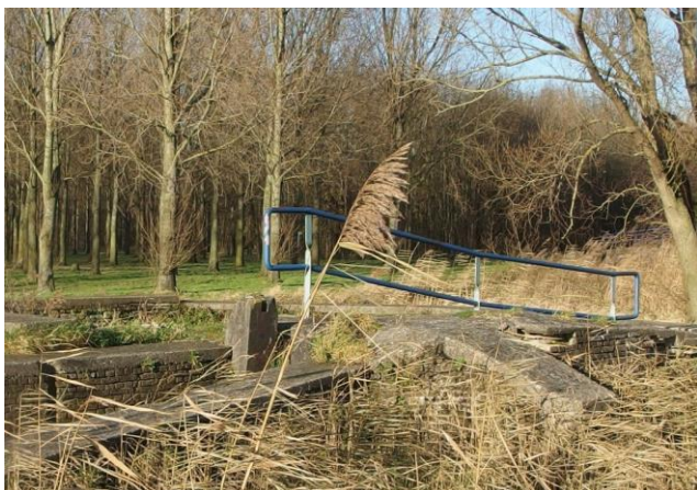
Fundamente van de afgebroken Essemolen, langs de Molenwetering © Liesbeth den Haan.

Uw IVN-gids is Liesbeth den Haan, die in het kader van haar Natuurgidsenopleiding, zich heeft verdiept in Hitland.