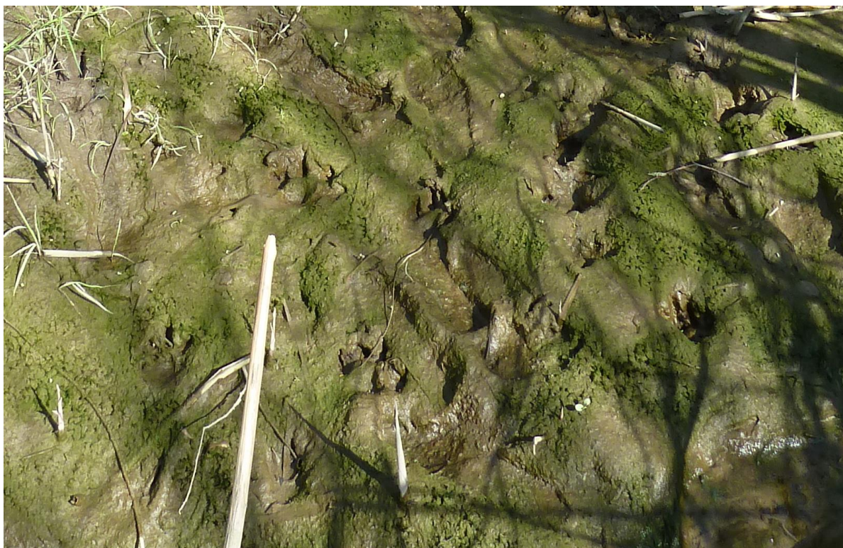
Beverporen in de Carnisse Grienden

Naast water zijn planten ook belangrijk voor het voortbestaan van bevers. Het zachte hout van bomen als de wilg en de populier en kruidachtige planten staan hoog op zijn menukaart. Aan het ontstaan van kruidachtige planten leveren ze zelf een bijdrage. Door het om knagen van bomen creëren ze open plekken waarop licht genoeg kan vallen voor de groei van kruidachtige planten. Muizen, vlinders, vogels en andere dieren kunnen daar ook mee van profiteren. Op om geknaagde bomen en achtergelaten boomstronken kunnen mossen en varens groeien. Paddenstoelen en insecten zorgen voor vertering van de bomen en boomstronken, waardoor weer een goede voedingsbodem voor planten ontstaat. De insecten in de dode bomen zijn voedsel voor vogels. Uit het voorgaande blijkt dat de bever een waardevolle bijdrage levert aan de diversiteit van planten en dieren langs water.