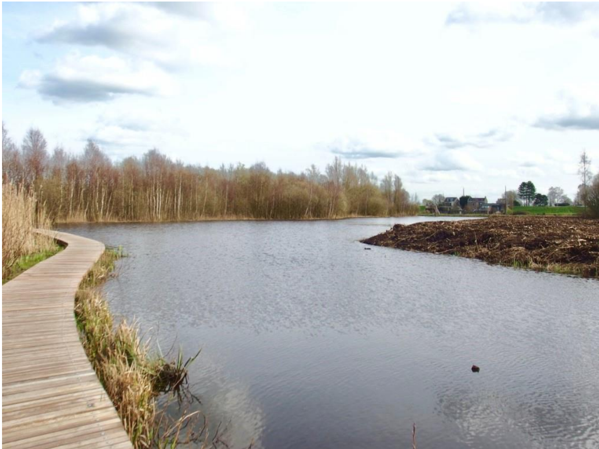
Op de foto het uitgebaggerde deel van het moerasgebied, met op de voorgrond de vernieuwde vlonder en op de achtergrond de uitkijkpost die in 2016 al was geplaatst

De verhoging van het waterpeil in het moerasgebied tevens vogelrustgebied was dringend noodzakelijk. Natte natuur daar krijgt nu weer de kans zich te handhaven. Het waterpeil was te laag geworden door defecte waterbouwkundige voorzieningen. Uitbaggeren en vergroten van het wateroppervlak was nodig om het proces van verlanding in een deel van het gebied terug te draaien.