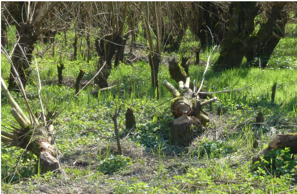
Knaagsporen in de Carnisse Grienden

Hoogte- en stroomsnelheid van het water regelen ze vaak zelf door als sluiswachter te fungeren. Bij de opening van de aangelegde dam schuiven ze net zo lang met takken en stammen heen en weer tot alles naar wens is. De droge- en natte kamer kunnen zo bij een wijzigende waterstand hun functie behouden. Door de sluissystemen ontstaan op diverse plekken oevers en slikken met een verschillend waterniveau. Dat geeft zowel plantensoorten die van natte-, drassige- als van droge grond houden een kans. Ondiep water geeft ook kansen voor kikkers, padden, libellen en andere waterdieren.