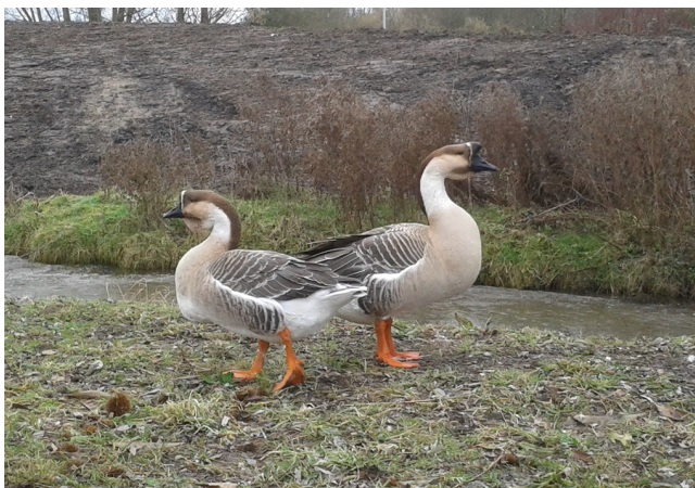
Foto ingestuurd door Mariëtte Beuzenberg. Het kostte haar wat moeite de naam van deze soort te achterhalen. Het gaat om een exoot afkomstig uit China: de Chinese knobbelgans. Zij fotografeerde het stel, eind januari, langs het Havenspoorpad (fietspad) in Rotterdam-Lombardijen.