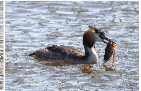
fuit met kreeft