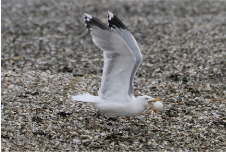
een ei hoort erbij