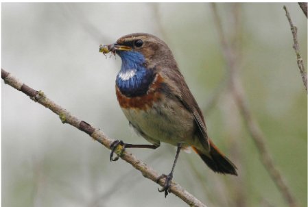
blauwborst een insecteneter