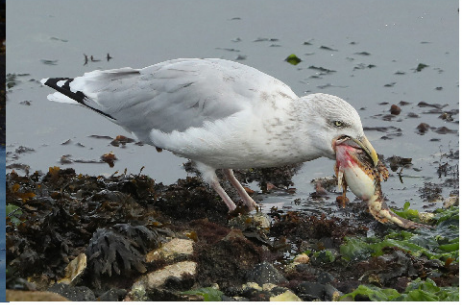
meeuw met donderpad