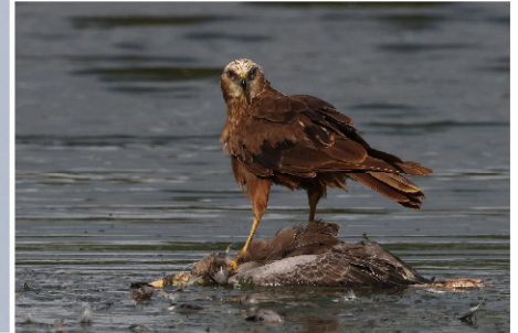
bruine kiekendief met gans