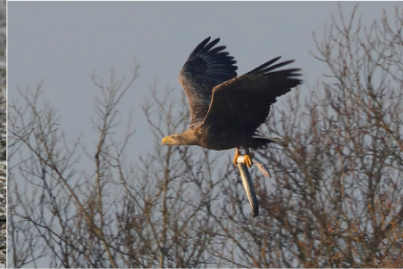
zeearend met paling