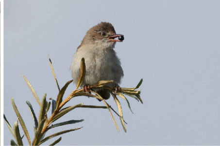
grasmus met bes