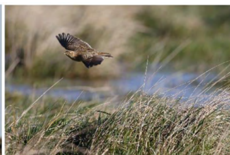
Op zoek naar een territorium