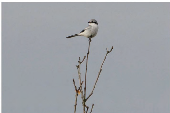
Klapekster op z'n favoriete uitkijkpost. De top van een struik

Hij kan tijdens de jacht, net als een torenvalk, bidden.