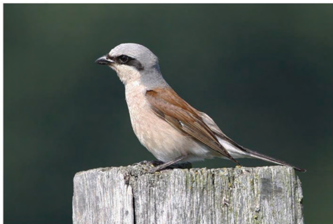
De grauwe klauwier als goedgelijkend familielid