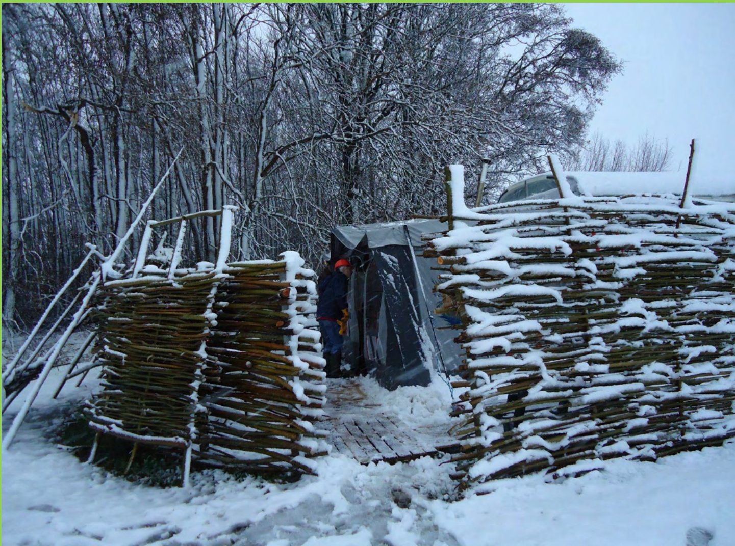
Het winterverblijf van de werkgroep Beheer in het Everland