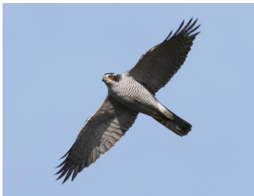
Adulte havik (oranje oog)