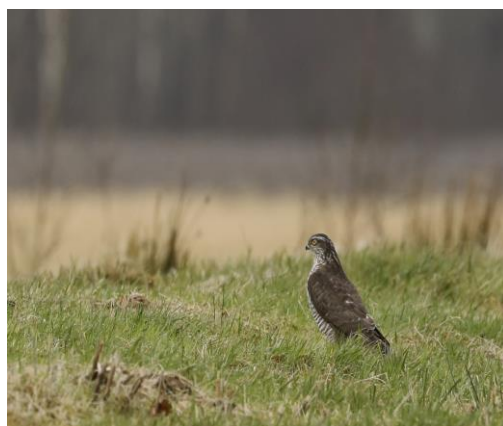
Adulte sperwer vrouw