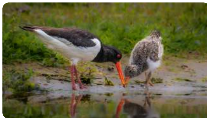
Scholekster met jong

Paddenstoelen Meinweg St. Ludwig 9.00 uur, Hotel St. Ludwig, Station 22, 6063 NP Vlodrop