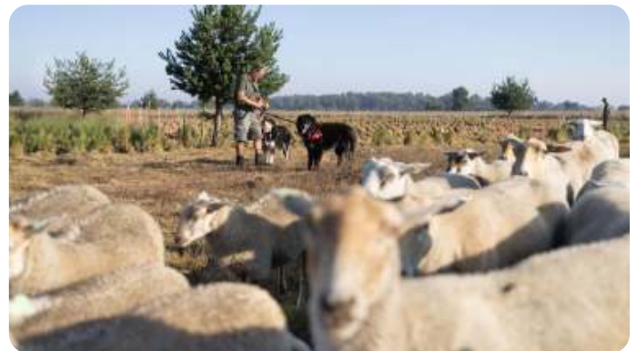
Staatsbosbeheer test inmiddels de bescherming van schapen met honden. De 'kuddelijfwachten' zijn inmiddels aan het werk op de Veluwe, de Strabrechtse Heide en De Meinweg. Foto Staatsbosbeheer.

Foto wolven pagina 5 afkomstig van Pixabay