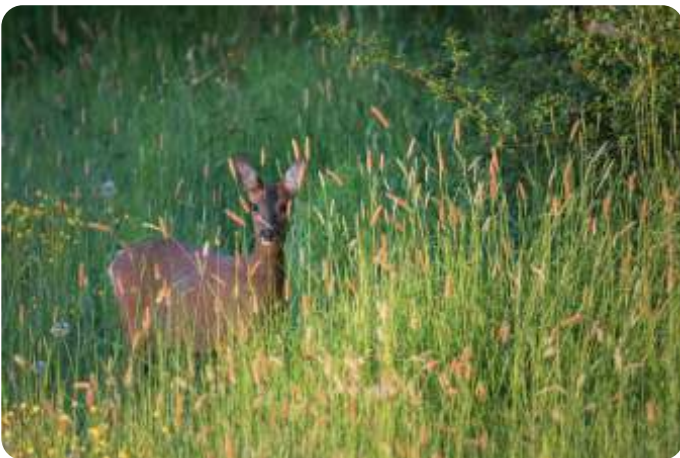
Onder andere reeën zijn prooidieren van de wolf

Wolven die vee doden zijn meestal zwerfende doortrekkers. Gevestigde roedels voeden zich hoofdzakelijk met wilde prooidieren als reeën, herten en (als het gaat om grotere roedels) wilde zwijnen. Bovendien is het met goed geplaatste wolfwerende hekken of in het hoeden en beschermen van schapenkuddes gespecialiseerde honden goed mogelijk om wolven in de meeste gevallen buiten het bereik van landbouw- en hobbydieren te houden.