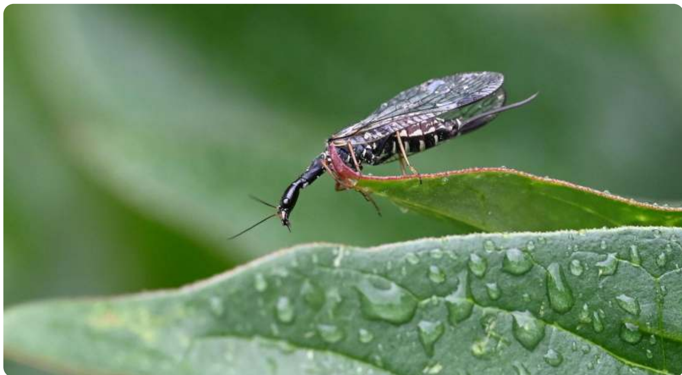
Slanke kameelhalsvlieg