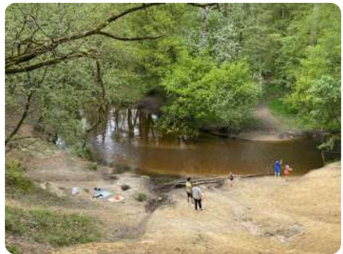
De Litsberg, het blijft een unieke plek