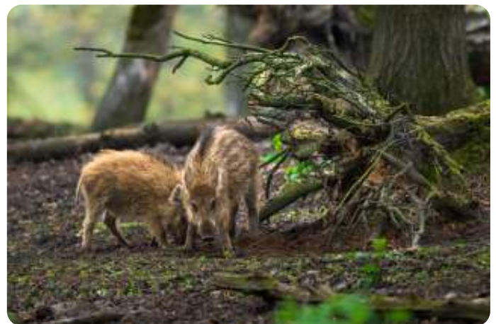
Jonge wilde zwijnen, biggen, ook wel frislingen, foto Peter Keijer

Vooraf aanmelden voor niet-leden verplicht: speurneuzen@ivnroermond.nl