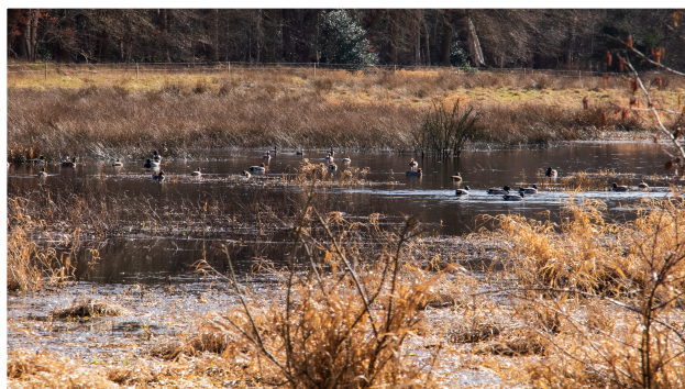
Bij de oevers van de Slokkert