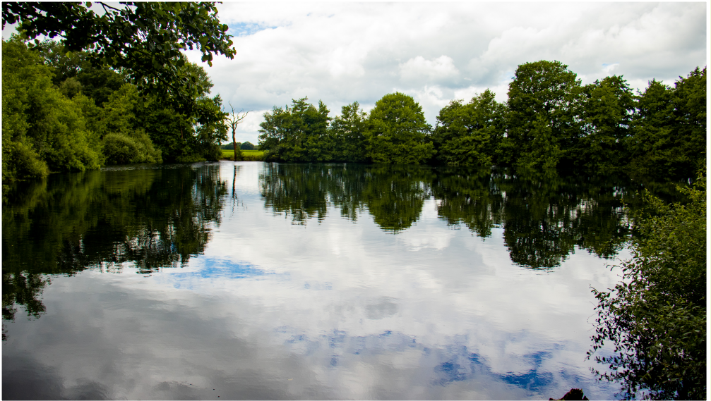
De pingoruïne bij het Norgerholt

De wandelroute start bij het Norgerholt, een van de oudste bossen van Nederland (9de eeuw), met grote oude beuken, eiken en hulst. U loopt langs een mooie pingoruïne en door het stroomdal van de Slokkert. Dit riviertje maakt deel uit van een stroomlandschap dat is ontstaan in de voorlaatste ijstijd door het terugtrekken van de dikke lagen sneeuw en ijs. Het laatste deel van de route gaat door het Tonckensbos. Dit bos is in de vorige eeuw door de familie Tonckens aangelegd als productiebos en een deel is dat nog. Het zuidelijke deel is in bezit van Natuurmonumenten en het oude grondwaterpeil is hersteld. De productieboomen gaan dood door de hogere waterstand.