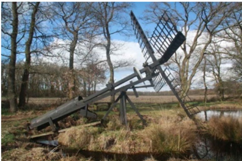
De tjasker bij het Bollenveen